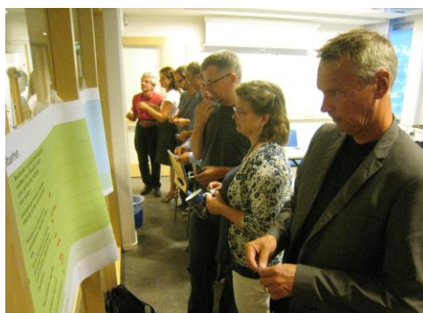
Figur 4. Bilder från workshop

Efter en inledande beskrivning av Ältaområdet delades deltagarna in i fyra grupper utifrån de olika hållbarhetsområdena ekologisk, ekonomisk, strukturell och social hållbarhet. En tabell på exempel på aspekter att beakta för respektive område delades ut. Efter redovisning av respektive grupp genomfördes en omröstning bland samtliga angående de viktigaste frågorna att fokusera på inom respektive område. Ett andra grupparbetesmoment syftade till att formulera de tre viktigaste målsättningar för vardera av de fyra aspekterna. Detta gav ett resultat på tolv prioriterade hållbarhetsmålsättningar som redovisas nedan under punkt 4.3. Målen färgkodades i enlighet med de olika hållbarhetsaspekterna: