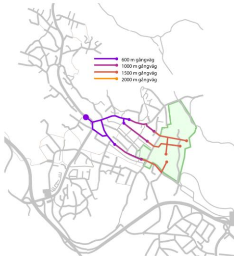
Gång-/cykelavstånd till mataffär samt buss 401, 821, 840, 491 (natt)