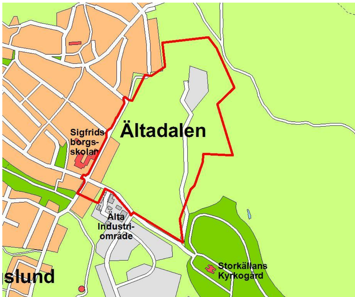
Bild 1. Planområdet

Planområdet ligger i östra delen av Älta och omfattar en areal om drygt 33,6 ha. Området begränsas i öster av Storkällans kyrkogård och naturmark som hör till Erstavik – i norr av resterande del av Erstavik 25:32, i väster av bebyggelsen på Åsvägen och Lovisedalsvägen, samt i söder av Storkällans väg. Områdets avgränsning framgår av bifogad karta (bild 1).