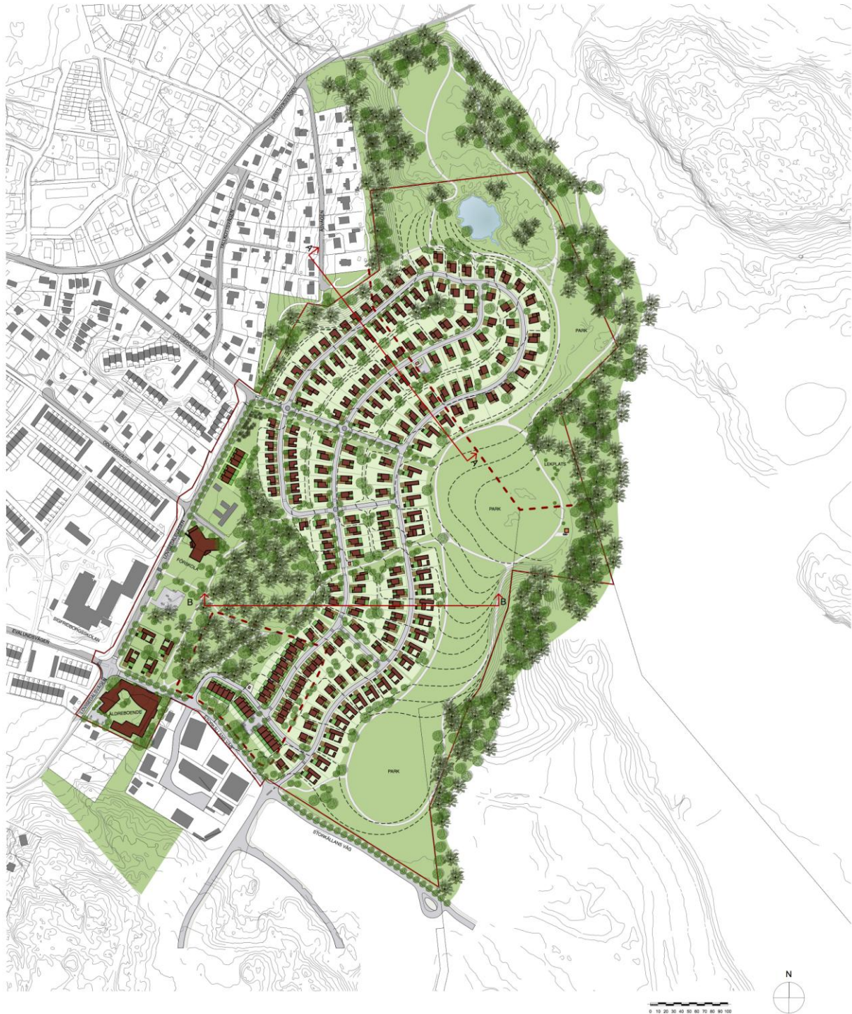
Bild 2. Illustration till detaljplan för Ältadalen, ÅWL arkitekter

I en illustration till detaljplanen som har tagits fram av ÅWL arkitekter redovisas tänkbar bebyggelse. Bebyggelsen föreslås huvudsakligen bestå av friliggande småhus (villor och radhus), samt förskola och äldreboende. De östra och norra delarna lämnas obebyggda som en del av ett större parkstråk genom Älta och vidare ut mot Erstavik (bild 2).