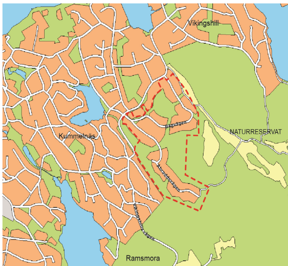
Gräns för förslag till detaljplan för område Bågvägen/Åbroddsvägen