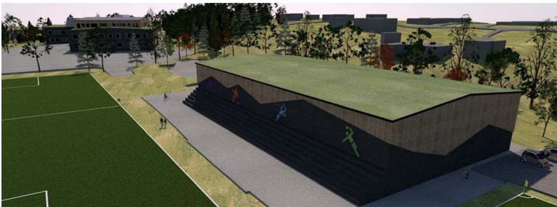
Översiktspåskild sporthall, från öster. Bild: Scharc Arkitekter 2017

Lokalprogrammet som kommunen tagit fram har prövat olika lägen för en ny sporthall. I diskussion med verksamheten, kommunen och Boo FF:s styrelse har en placering norr om Boovallen valts. På så vis behöver Boovallens bollplaner ej läggas om och idrottsverksamheten kan därför fortgå även under byggtiden. Byggnaden bör kunna fungera som en ljudbarriär för några av villorna norr om Boovallen. Sporthallens långsida mot Boovallen utformas som sittläktare. Sporthallen föreslås kläs i trä- eller stålpanel. Särskild omsorg bör ägnas sporthallens norra fasad, då denna ligger nära granntomten och kan uppfattas som visuellt störande. För att mjuka upp fasaden föreslås därför att fasaden planteras med klätterväxter.