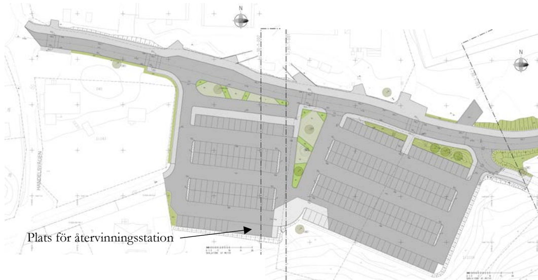
Översiktlig plan parkering. Bild: Sigma 2017