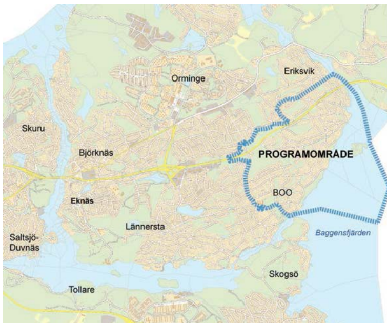
Programområdets omfattning, ur ”Program för sydöstra Boo”, Nacka kommun 2012

Detaljplaneförslaget stämmer överens med riktlinjerna i programmet.