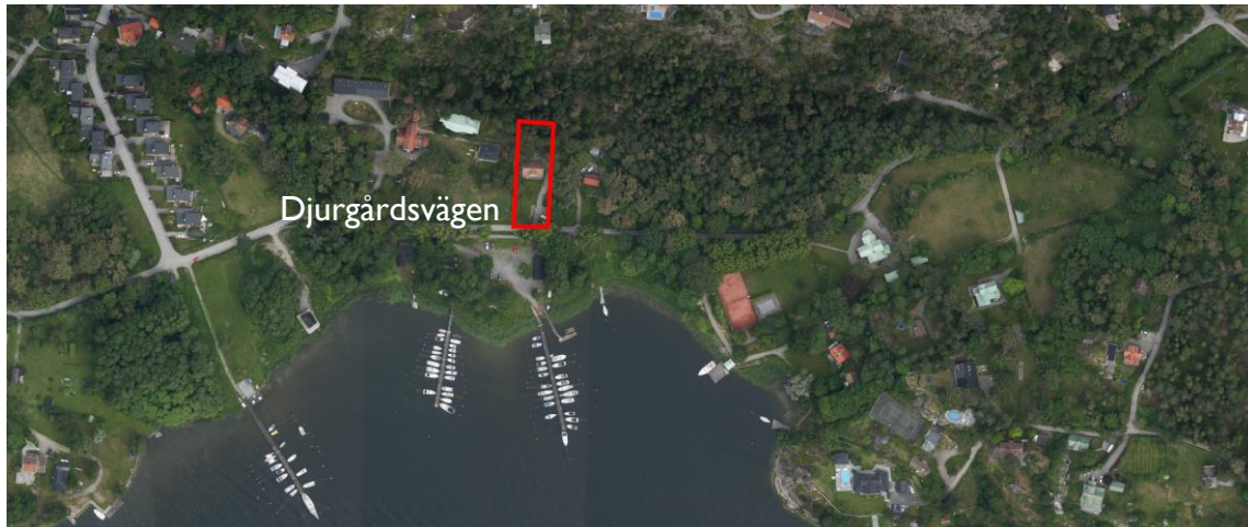
Kartan visar ett flygfoto över området

Planområdet utgörs av fastigheten Lännersta 1:1244, avstyckad från intilliggande fastighet Lännersta 1:907 den 21 januari 2012. Fastigheten ligger invid Djurgårdsvägen i kommundelen Boo, är cirka 2 550 kvadratmeter till ytan och ägs av privatperson.