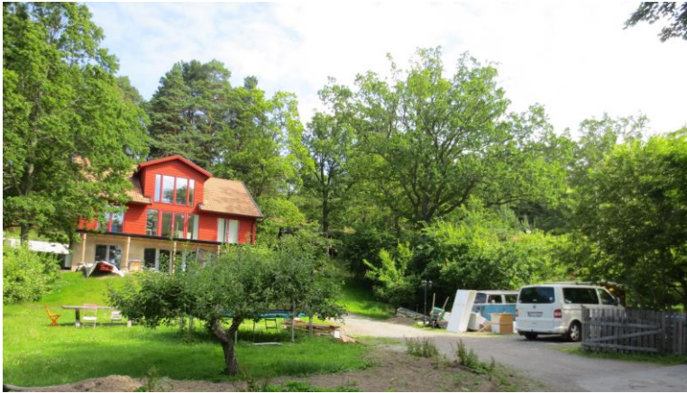
Fastigheten sett från söder.