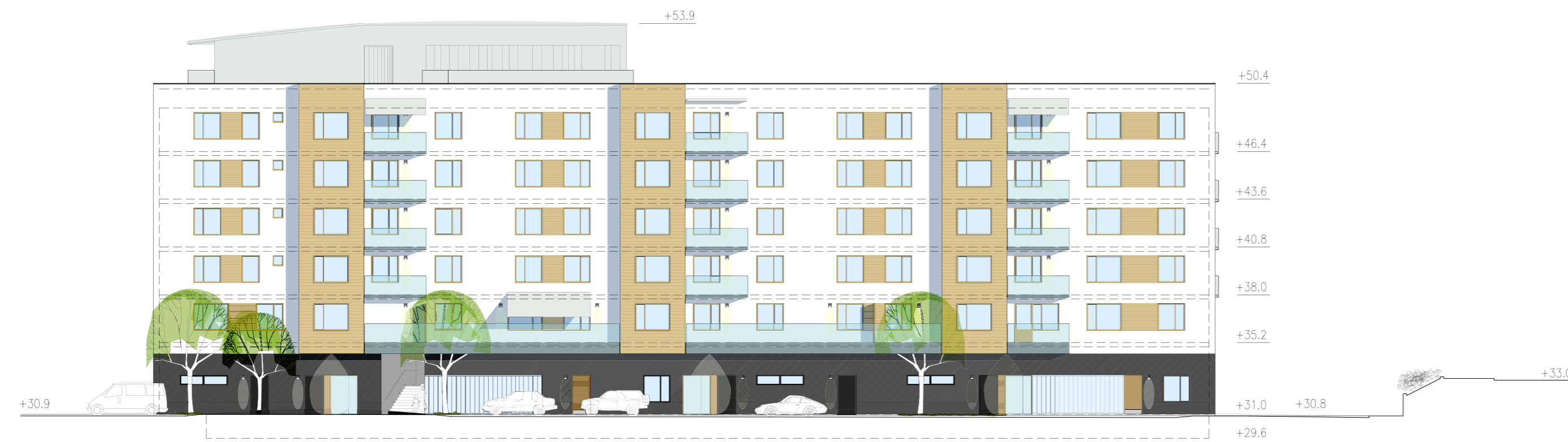
B2 - ELEVATION MOT VÄSTER

" Att skapa kvaliteter i områdets östra del vid det befintliga parkeringshuset genom att integrera ett nytt p-garage (ca 175 platser) i ett sammanhållet bostadskvarter (B1-3) och bredda gatan mot det gamla polishuset.