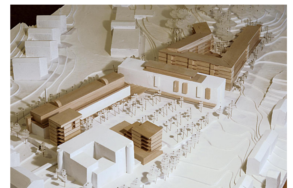
EKTORP CENTRUM - MODELL