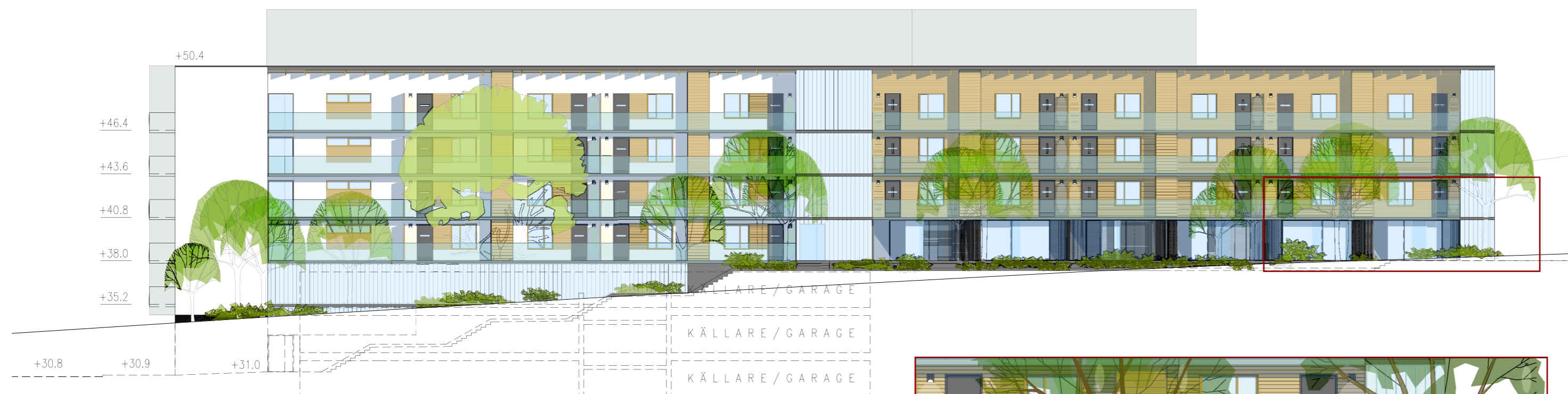
B1 - ELEVATION MOT SÖDER