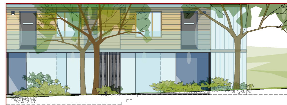
B1 - UTSNITT