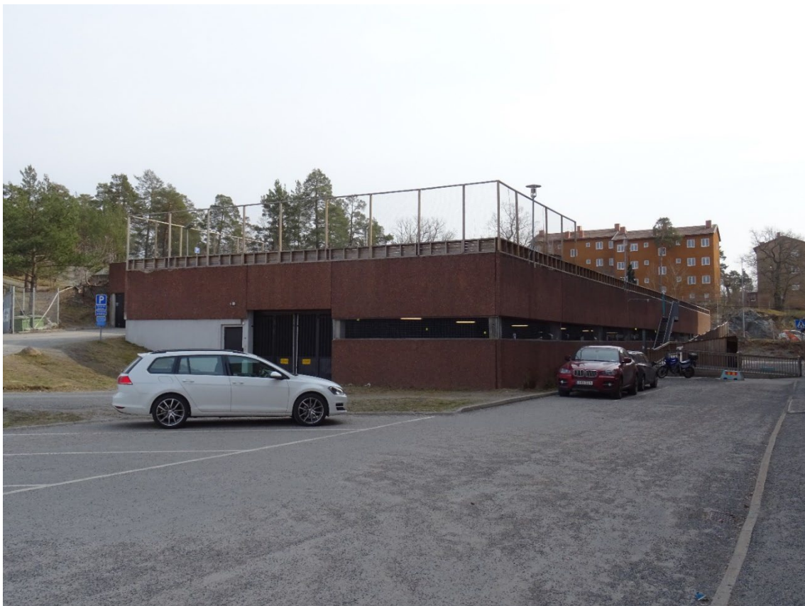
Parkeringshuset, vy mot söder.