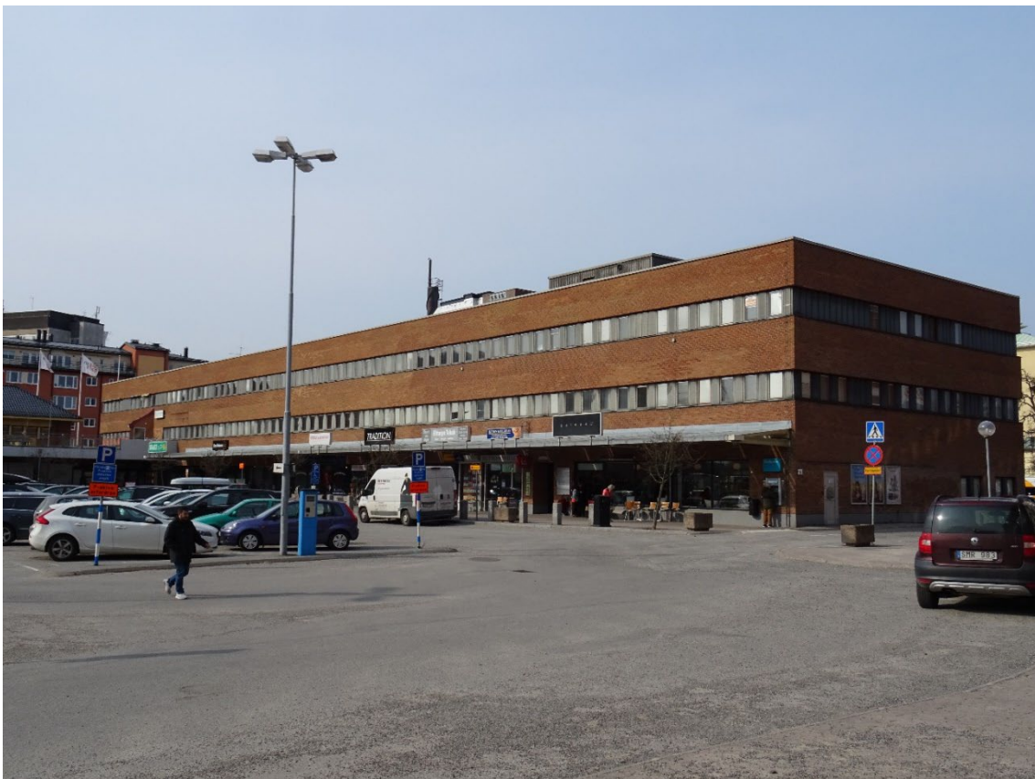
Lamellhuset sett från torget.