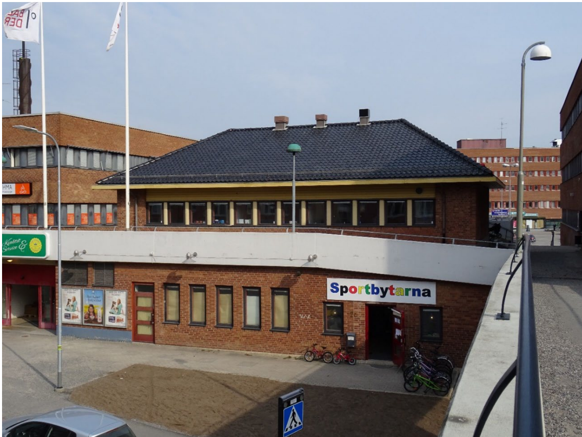
Förskolan, f d kurslokaler sedda från bron över Ektorpsvägen.