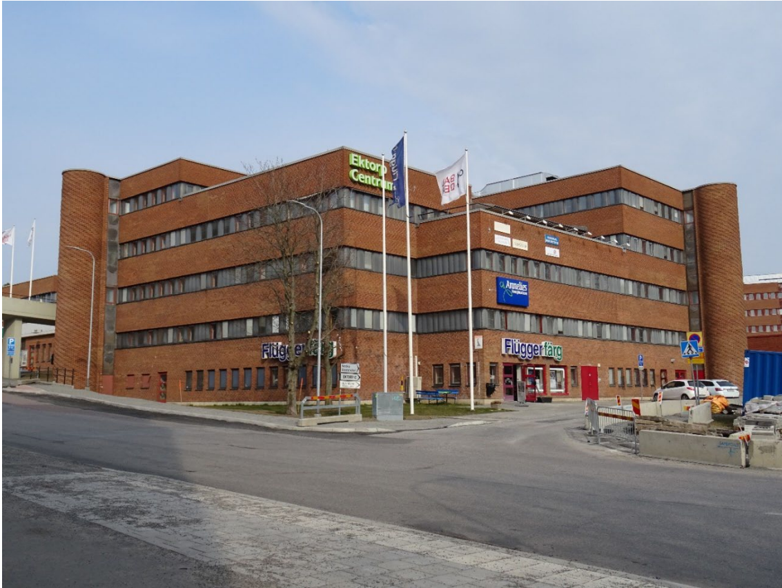
Punkthuset sett från Ektorpsvägen.