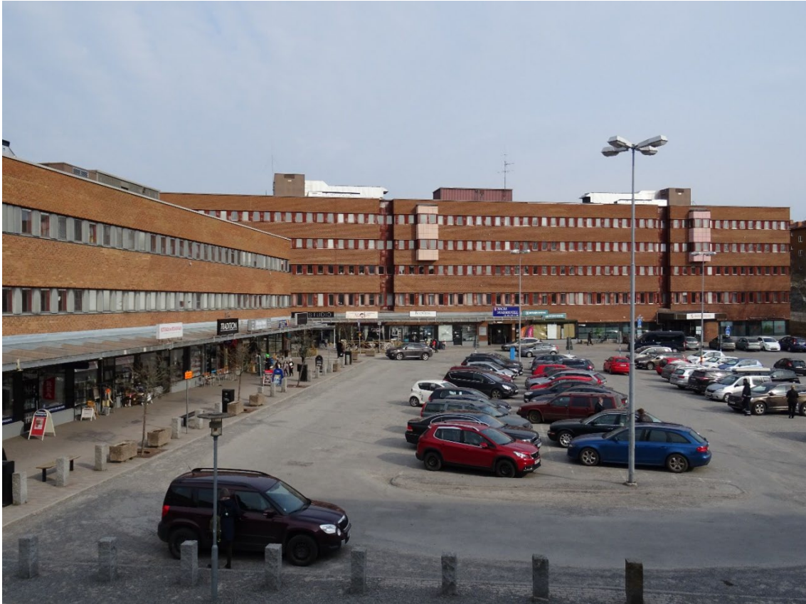
Lamellhuset till höger och kontorshuset rakt fram sedda från plan 1 vid förskolan.