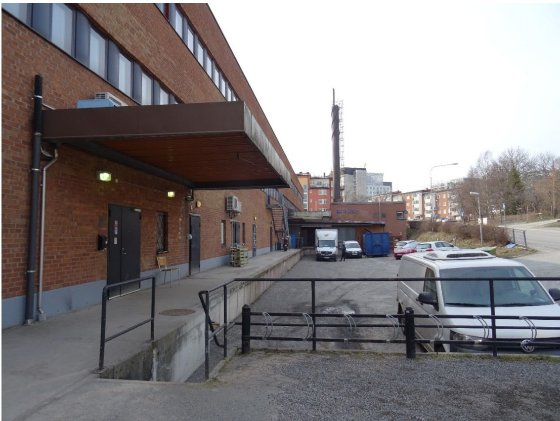
Panncentral och lastbryggor ligger på lamellhusets baksida vid Gamla Landsvägen.