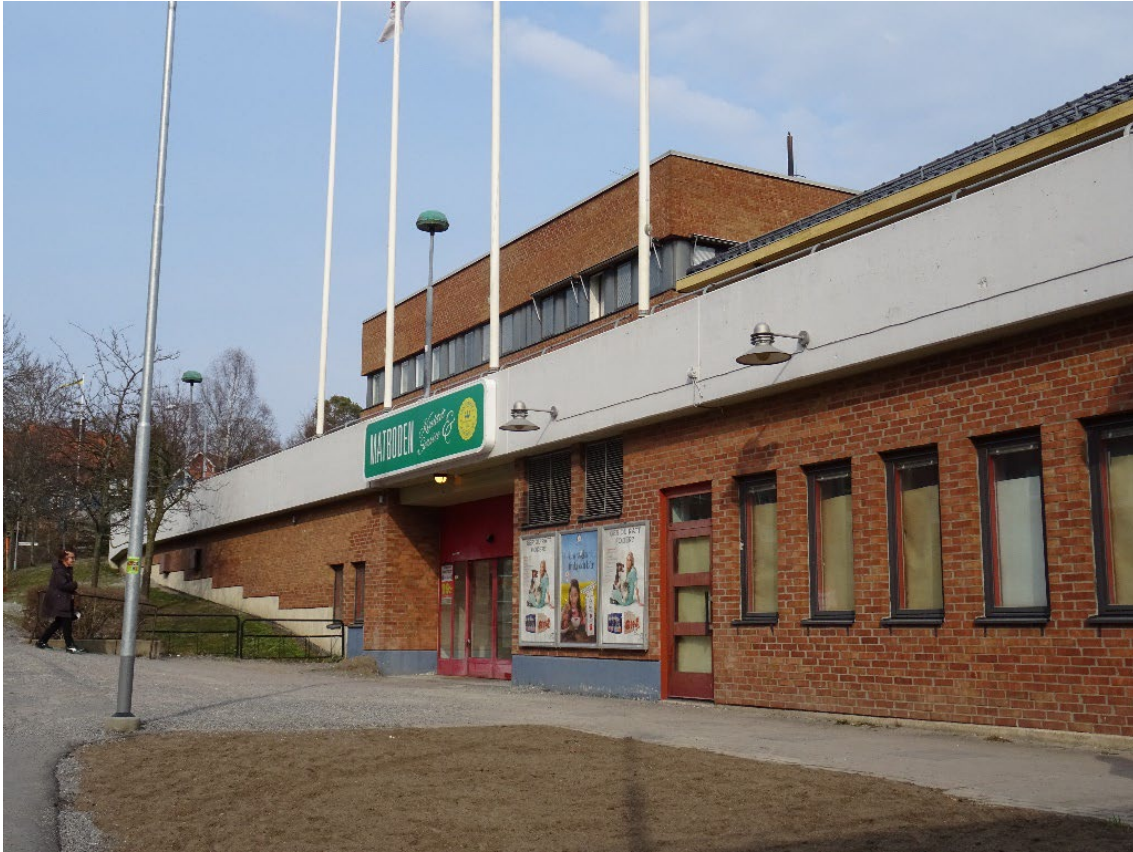
Entrén till torget genom en passage från Ektorpsvägen.