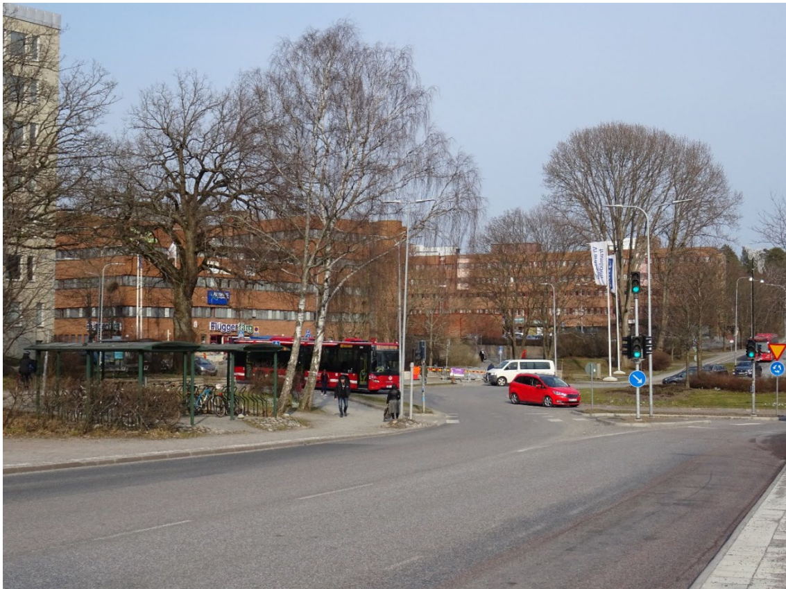
Ektorp centrum sett från Värmdövägen.