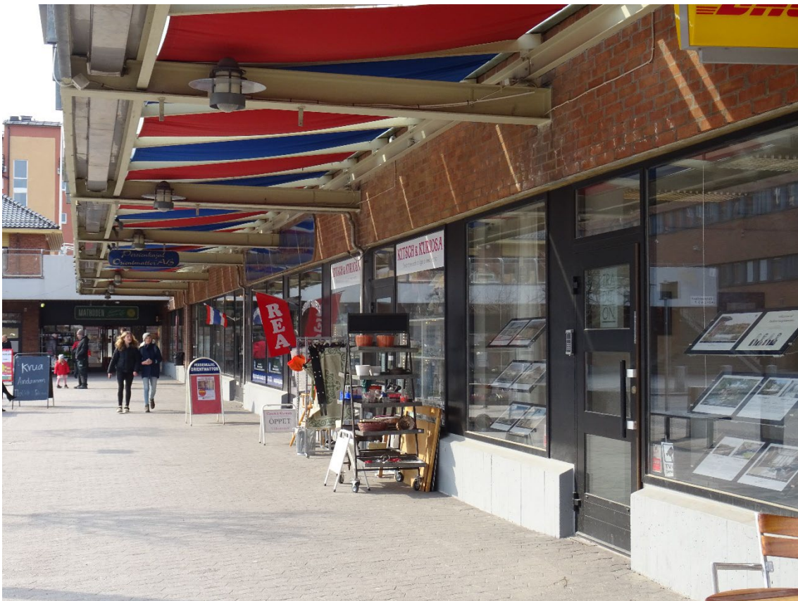
Affärerna vänder sina entréer mot det soliga torget. Skärmtaket och entréerna är ursprungliga och enhetligt utformade.