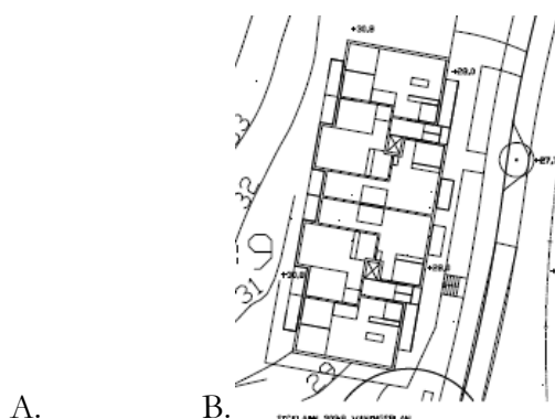
Figur 2. Föreslagen lägenhetslösning,

Med nuvarande utformning av huset innehålls Avstegsfall B, se figur 2.