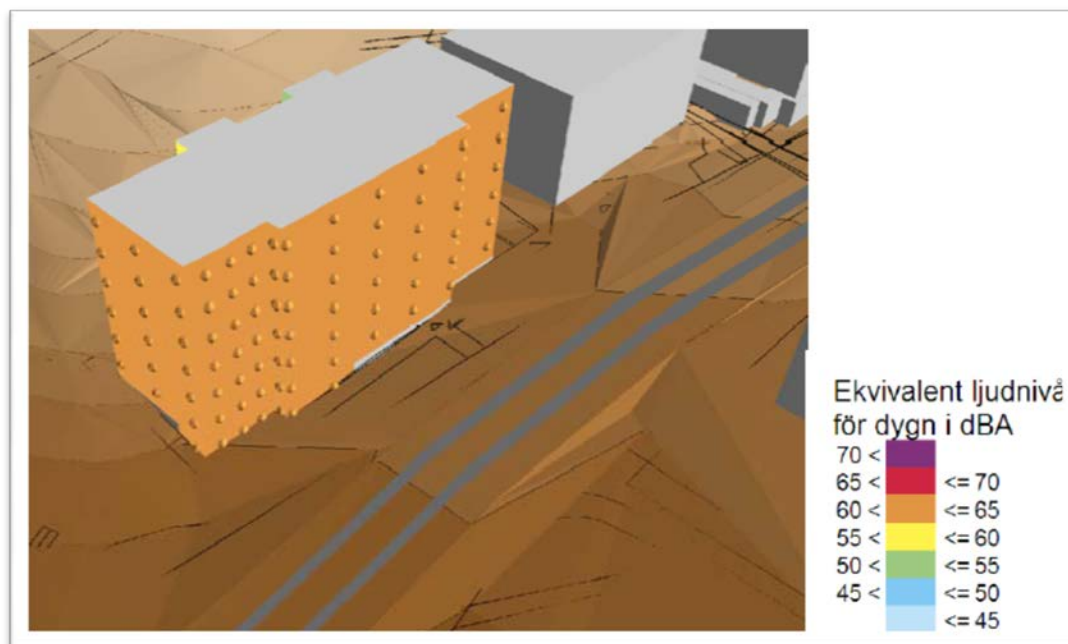
Figur 1. Ekvivalent ljudnivå vid fasad sett från sydost. I figur 1 redovisas den ekvivalenta ljudnivåerna vid fasad. Södra, norra och östra fasaden överstiger riktvärdet 55 dBA och får ekvivalenta ljudnivåer upp mot 65 dBA.

Den maximala ljudnivån blir upp mot 80 dBA längs fasader närmast Ektorpsvägen. Med uteplats som placeras på bullerdämpad sida kan riktvärdet 70 dBA. innehållas