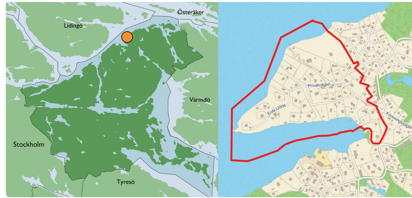
Planområdets läge i Nacka kommun