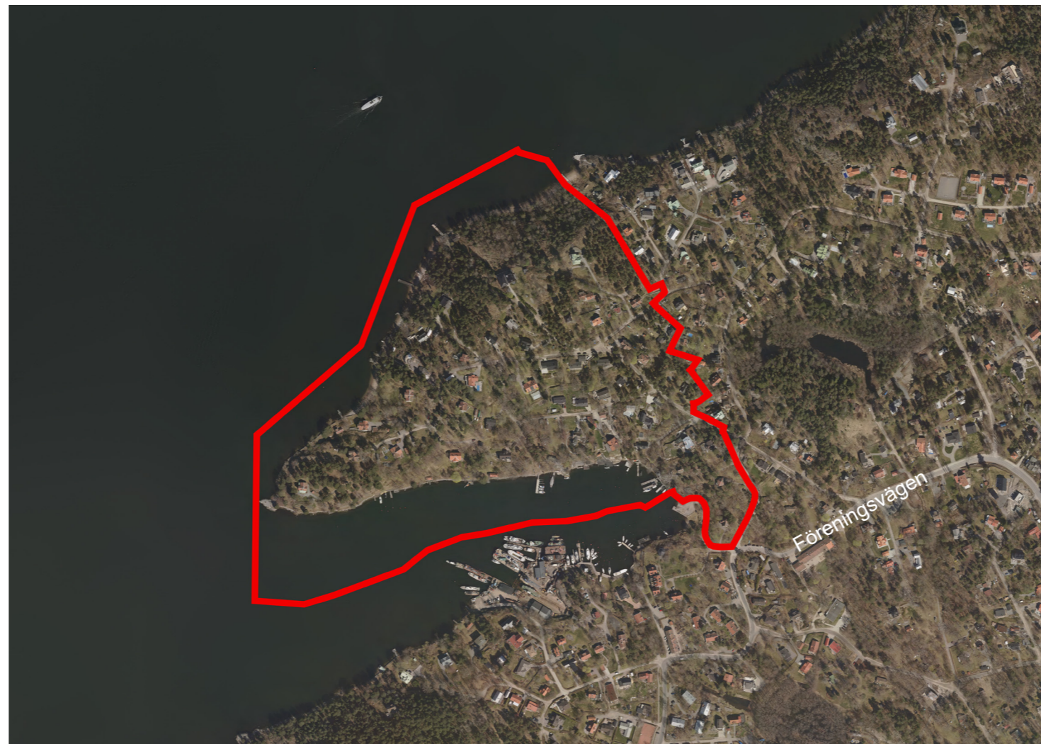
Flygbild med planområdets gränser