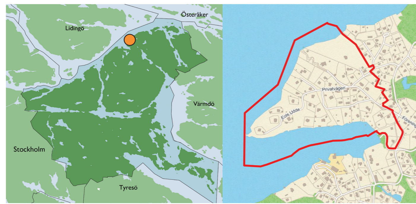
Planområdets läge i Nacka kommun