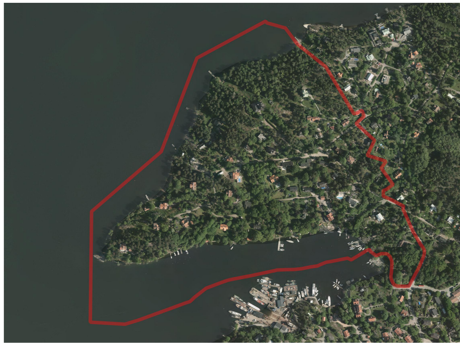
Flygbild med planområdets gränns