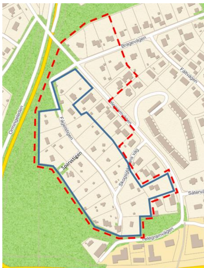
Kartan visar förslag till fördelningsområde med blå heldragen linje. Detaljplanens område visas med röd streckad linje.

I Fågelstigen avses kostnaderna enligt kostnadsunderlaget fördelas områdesvis. Fördelningsområdet innefattar fastigheter längs Fågelstigen, Skogsgläntans väg, Sparvstigen och Telegramvägen. Fördelningsområdet skiljer sig från planområdet, se kartan nedan. En sammanställning av samtliga fastigheter som ingår i fördelningsområdet finns i bilaga 1 .