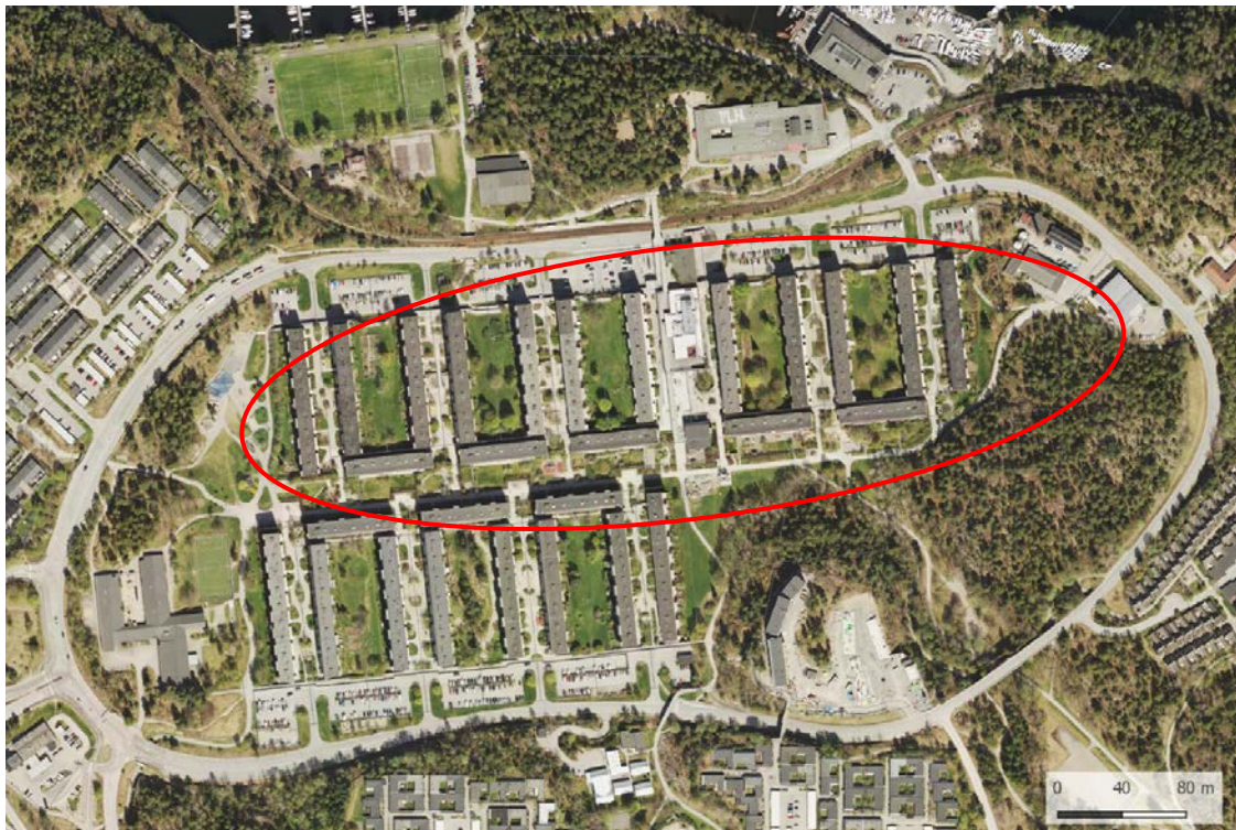
Ortofoto över centrala Fisksätra. Projektets ungefärliga avgränsning i rött.

Planområdet omfattar preliminärt befintliga parkeringsytor, centrumanläggningen och delar av befintliga gårdar. I hur stor omfattning gårdarna kommer att omfattas av planen ska utredas under planarbetet.