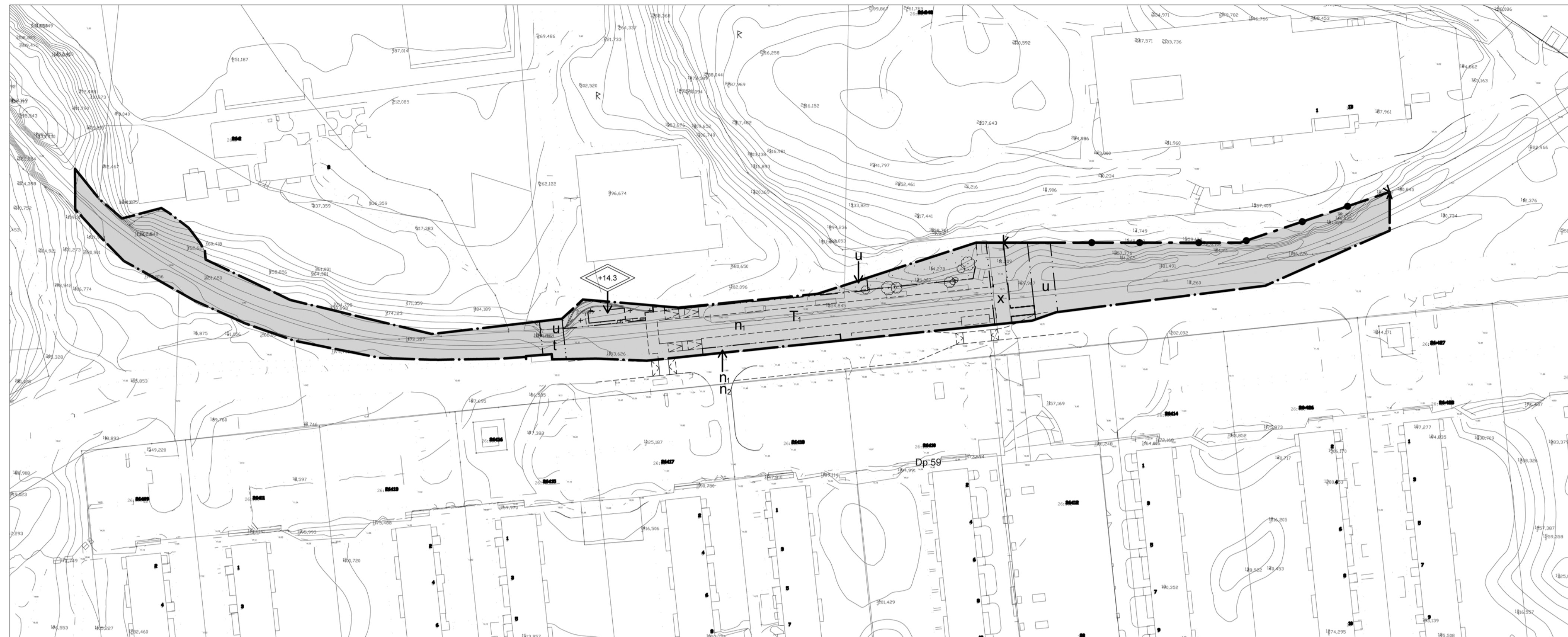
Plankarta med bestämmelser