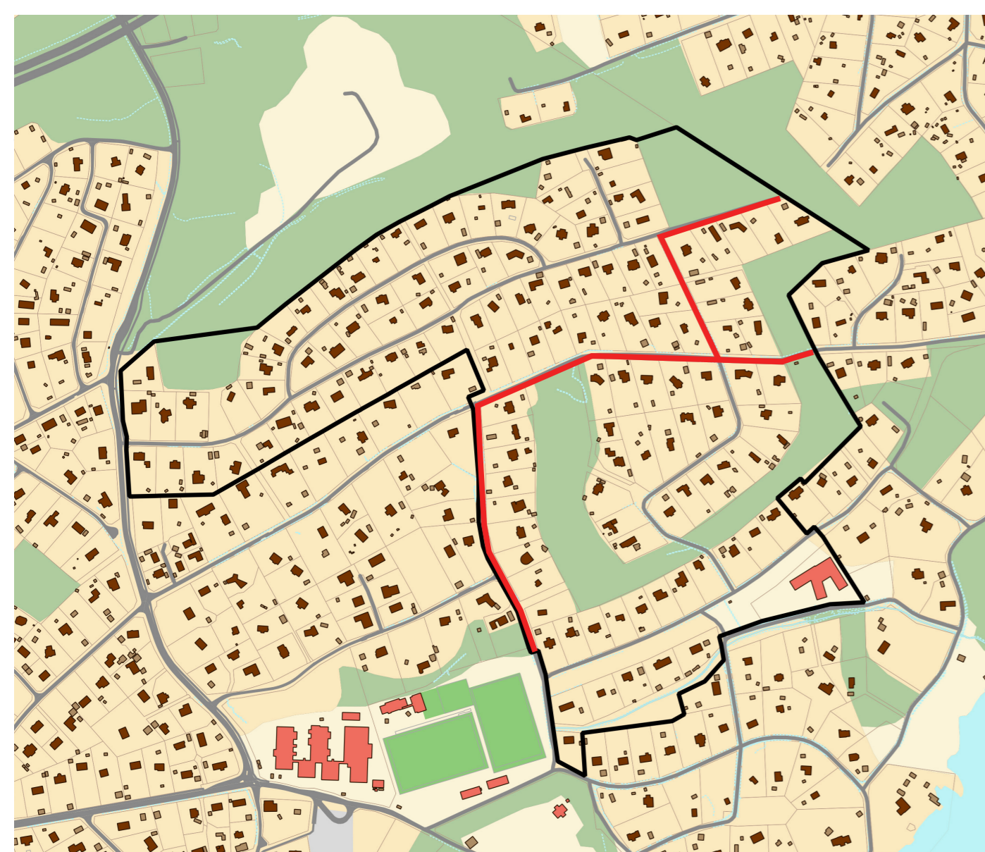
Området idag med föreslagna gångbanor