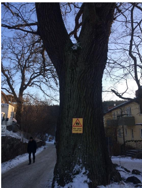
Figur 4. Jätteek vid Nysätravägen.

Detaljplanområdet, Sicklaön 276:1 ligger inom ett från Länsstyrelsen utpekade värdefulla trädmiljön. Vidare är detaljplanområdet del av en nord-syd gående spridningsväg mellan ädellövmiljöer (Figur 5) (Ekologigruppen 2014).