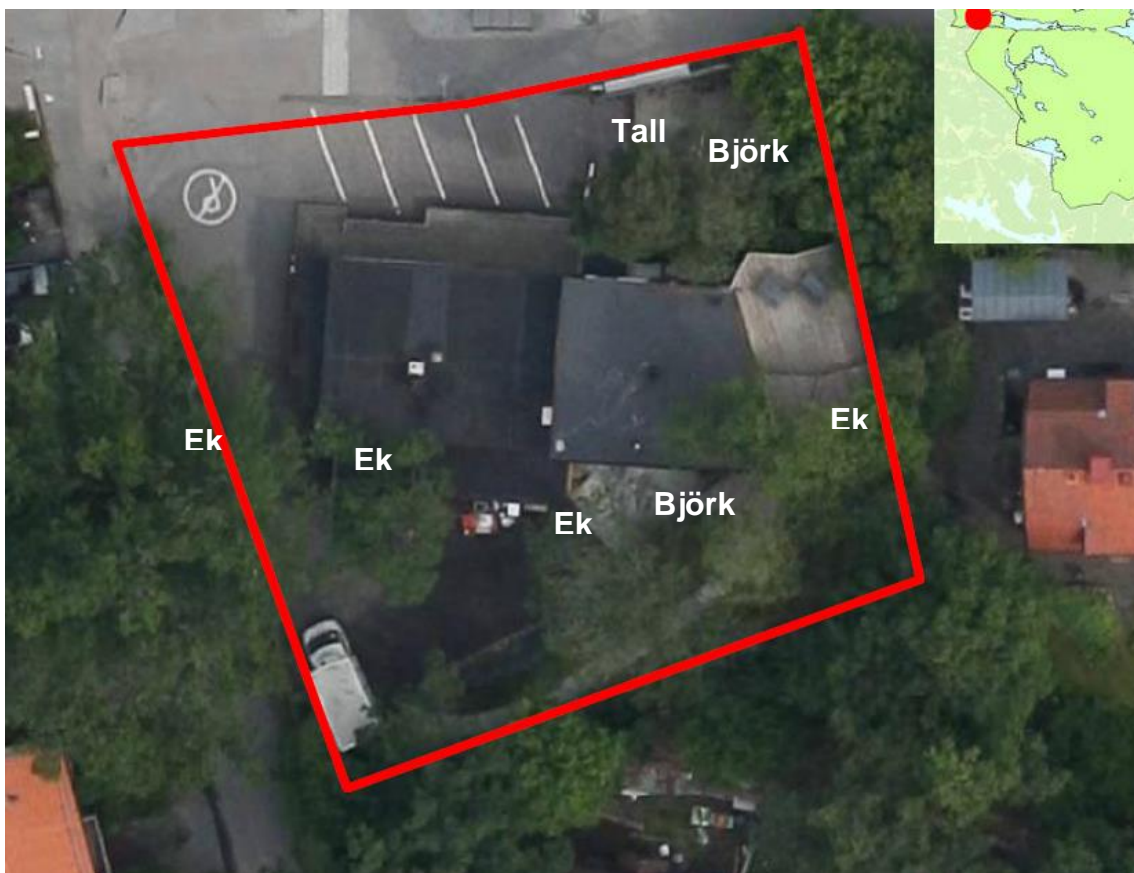
Figur 1. Detaljplanområde Sicklaön 276:1 och dess uppvuxna till stora träd.

Detaljplanområdet utgörs av tomtmark (Figur 1). Området innehåller hårdgjorda ytor, hus samt mindre icke-hårdgjorda ytor. Framför huset står en stor tall (runt 120 år gammal) samt en uppvuxen björk med begynnande panserpark (Figur 2). Bakom den östra delen av huset i en lite trädgård växer tre uppvuxna ekar och en björk (Figur 2). Bakom den västra delen av huset står i direkt anslutning till huset en gammal avbruten ek (Figur 3). På Nysätravägen stor en jätteek. Eken ha en diameter större en 1,20 cm och innehåller både håligheter samt död ved. Länsstyrelsen har utpekad eken som värdefull träd (Figur 4) .