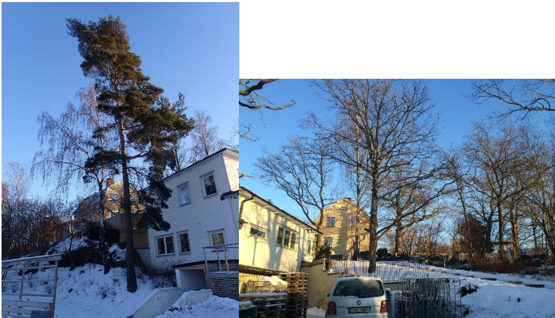
Figur 2. Tall och björk framför huset (tv). Ekar och björk bakom huset (th).