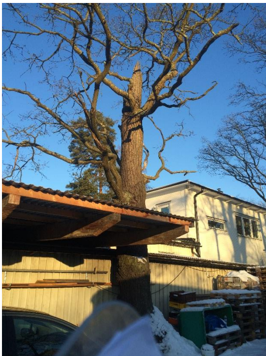
Figur 3. Avbruten ek direkt bakom huset.