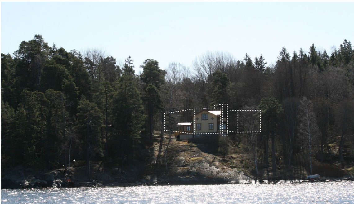
Vy från farleden, som visar att byggnadsvolymen inte kommer att synas från farleden (arkitekter: sr-k)

Bilden ovan visar en illustrerad volym av byggnadens placering, sett från farleden. Byggnaden kommer att vara placerad bakom trädridan och kommer inte att synas från farleden.