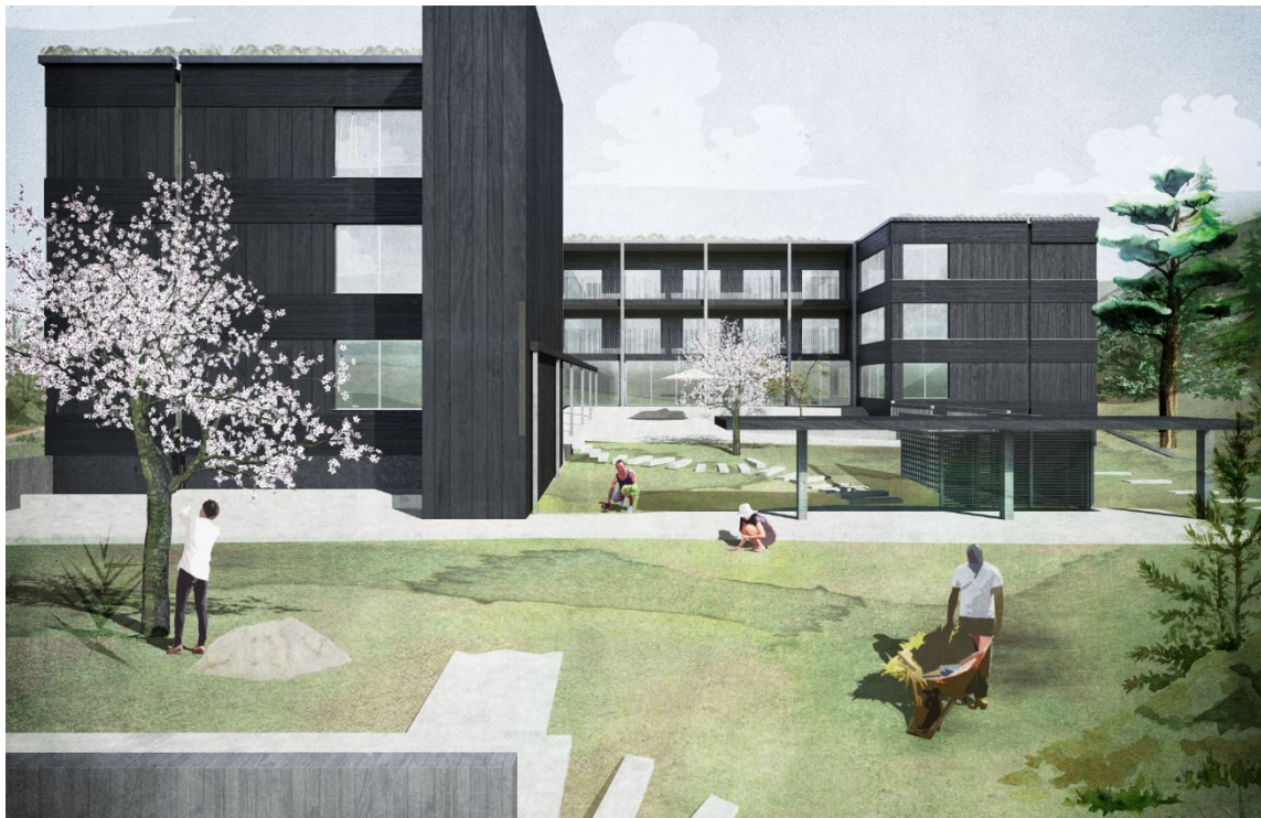
Illustration på innergård, med en möjlig utformning, från väster (arkitekter: sr-k)