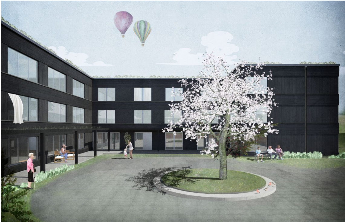
Illustration på entrégård, med en möjlig utformning, från öster (arkitekter: sr-k)