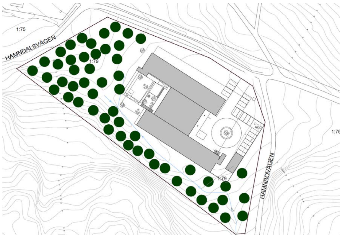
Situationsplan (arkitekter: sr-k)

Byggnadens tak utformas med sedum och med ett markerat takutsprång. Själva fasaden består av träpanel. Träfasaden föreslås i en mörk kulör för att anpassa byggnaden till omkringliggande tallskog samt anspela mot konferensbyggnaden Yasuragis färgsättning. Sophuset är en egen volym som står i anslutning till entré och parkering.