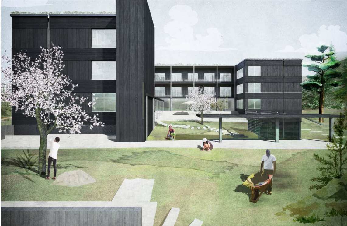
Illustration på innergård, med en möjlig utformning, från väster (arkitekter: sr-k)