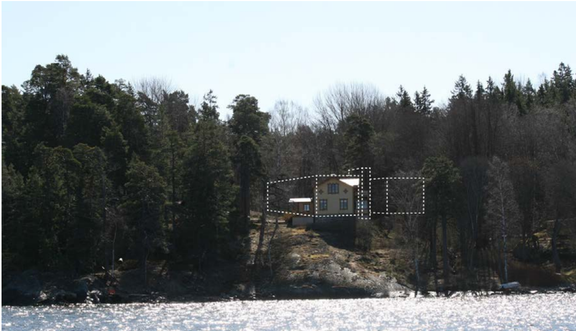
Vy från farleden, som visar att byggnadsvolymen inte kommer att synas från farleden (arkitekter: sr-k)

Bilden ovan visar en illustrerad volym av byggnadens placering, sett från farleden. Byggnaden kommer att vara placerad bakom trädriddån och kommer inte att synas från farleden.