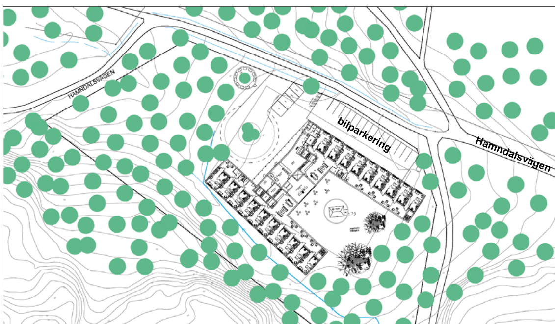
Situationsplan över planerad bebyggelse.