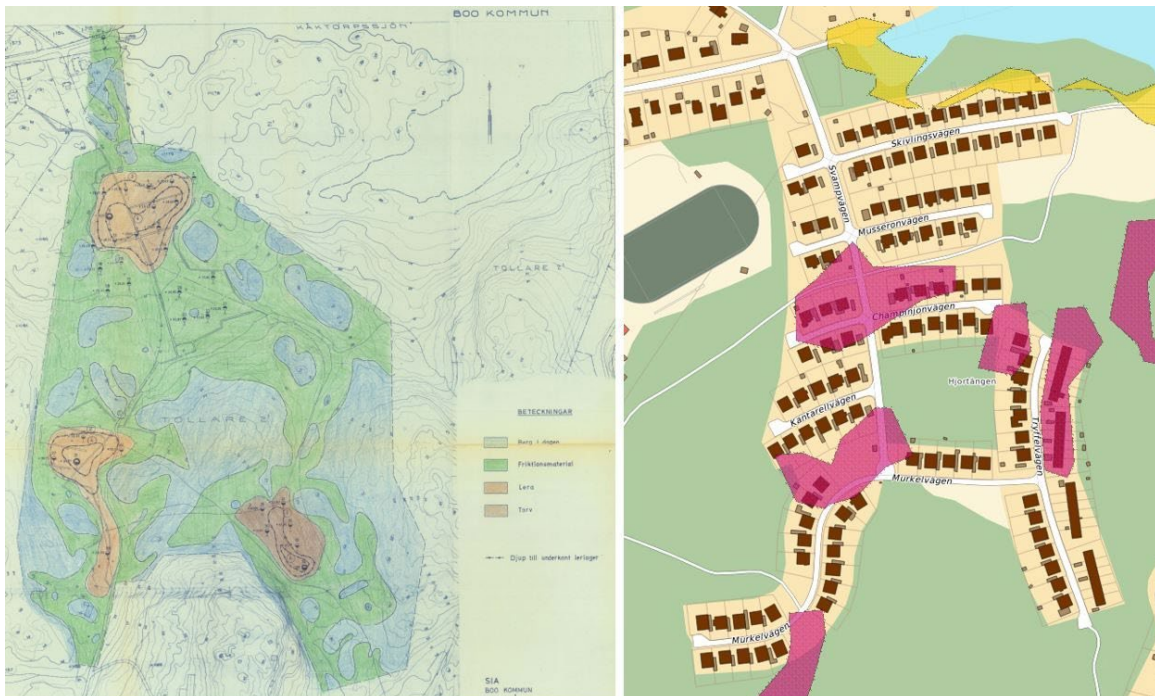
Figur 6 (t.v.). Bild ur översiktlig geoteknisk undersökning av området från år 1964. Berg i dagen (blå), friktionsmaterial som grus, sand, morän (grön), lera med överlagrad torv (brun). Figur 7 (t.h.). Områden med förutsättningar för skred (rosa), respektive strandnära skred (gult) enligt SGU.