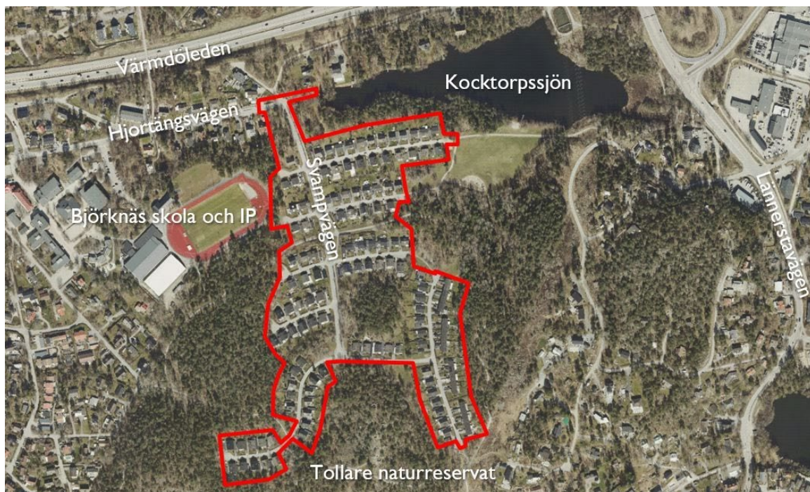
Figur 1. Kartan visar ett flygfoto över planområdet. Röd linje anger planområdets gräns.

Planområdet utgörs av småhusområdet Hjortängen som innehåller 111 villafastigheter och 24 radhusfastigheter samt kommunala gator och parkmark. Planområdet är cirka 12 hektar stort. Hjortängen är beläget i södra Boo, öster om Björknäs skola och IP, söder om Kocktorpssjön och Värmdöleden. Området omgärdas av Tollare naturreservat.