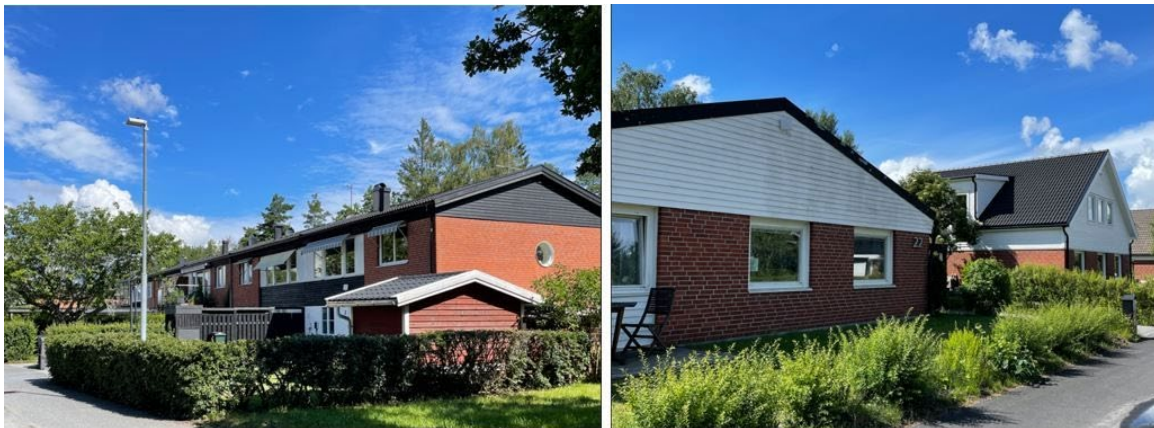
Figur 2. Befintliga radhus, ursprunglig enplansvilla och påbyggd villa med inredd vind och takkupa, från vänster till höger. Foto: Nacka kommun (2022)

Trots ändringarna visar bebyggelsen väl den högt mekaniserade tillverkningstekniken genom sina karaktärsdrag. Fasaderna är klädda med rött fasadtegel, medan gavlarna och takfoten oavsett takform är klädda med liggande, vitmålad fjällpanel på grändhusen, respektive svartmålad fjällpanel på radhusen. Fönstersättningen och fönsterformerna visar de olika hustyperna och taken är täckta med brunt eller svart betongtegel. Bortsett från några tillbyggda entréer är förändringar som påverkar den allmänna karaktären få.