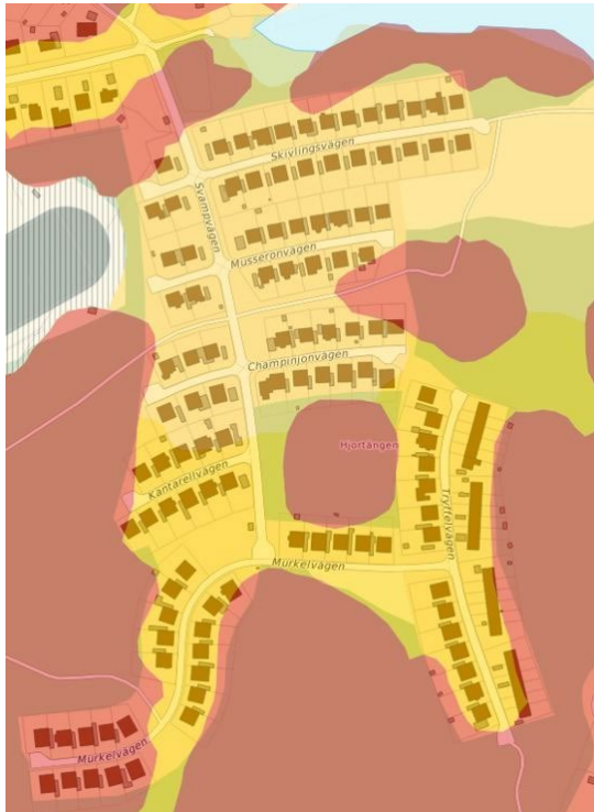
Figur 5. Jordarterna inom planområdet består av lera (gult) och berg (rött) enligt SGU:s jordartkarta.