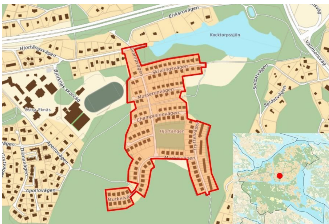
Kartan visar områdets avgränsning samt var i Nacka kommun området ligger.

Detaljplan för Hjortängen, fastigheterna Tollare 6:1 m.fl., i Boo, Nacka kommun