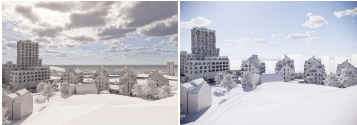
Utsikten från Birkaberget över Järlasjön och Nackareservatet vid genomfört planförslag. Birkaberget är ett omtyckt utflyktsmål för närboende i Birka och Finnorp. Utsikten över Järlasjön blir förändrad men sjön är fortfarande synlig. Bild till vänster: Utsikten vid genomfört planförslag. Bild till höger: Vita byggnader i fonden ingår i strukturplanen men har ingen lagakraftvunnen detaljplan.

Vad gäller detaljplaneprogrammet så anger det att Järila-Birkaområdets siluett ska beaktas. Planenheten bedömer att områdets siluett söderut beaktas av förslaget genom att siluetten fortfarande kommer att vara avläsbar söderifrån, genom de öppningar förslaget medger, även om siluetten till viss del skymms.