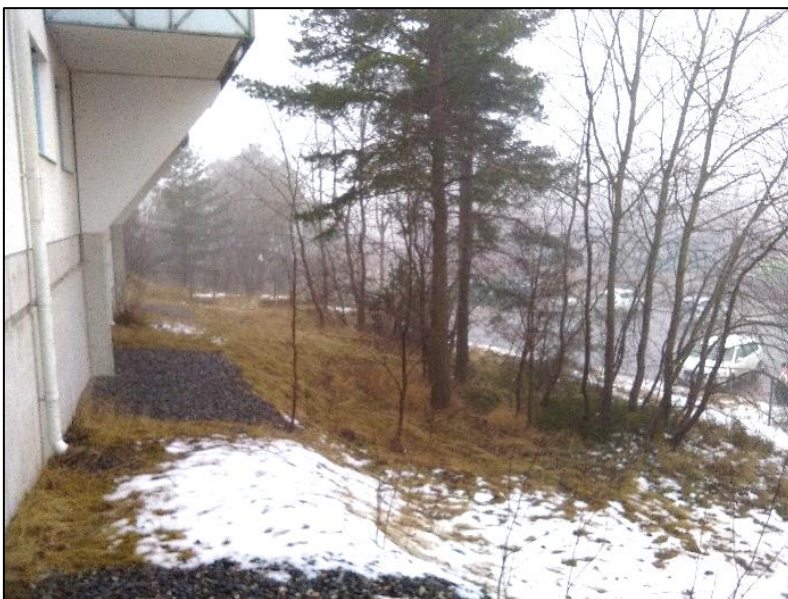
Figur 4. Utkastare från fastighet längs Diligensvägen. Parkeringsytan skimtar mellan träden.

I sydöst gränsar detaljplanen till fastigheter längs Diligensvägen. Fastigheterna längs Diligensvägen 104-114 har utkastare för takvattnet och dagvattnet väntas avrinna på naturmark mot detaljplanområdet, se figur 4. Därmed inkluderas denna yta i utredningsområdet.