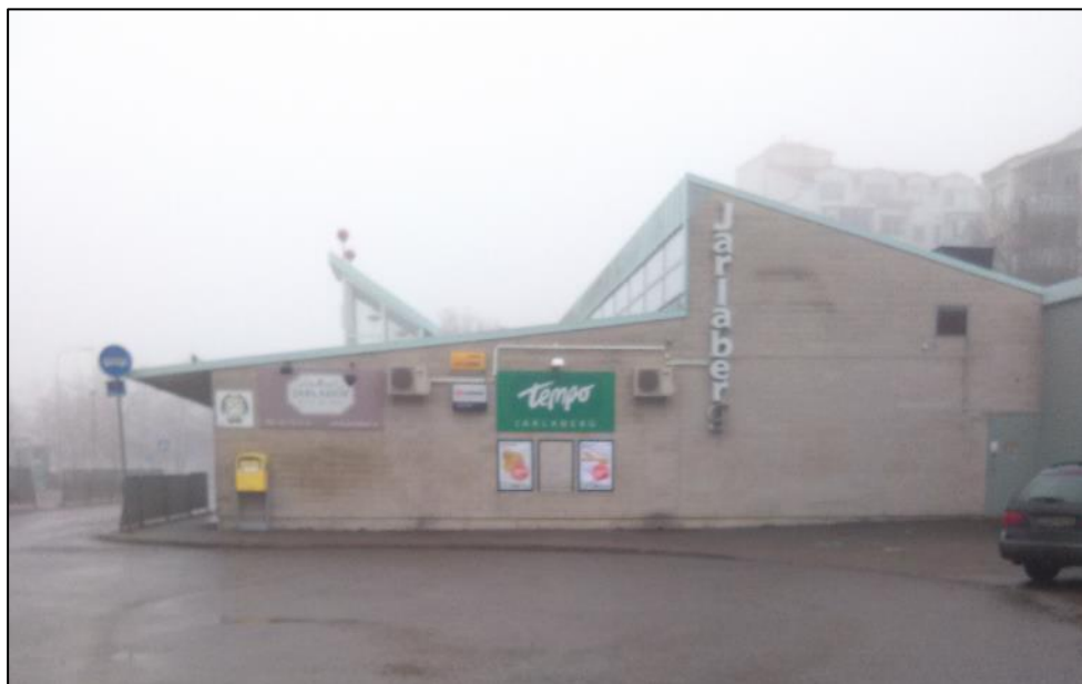
Figur 2. Befintlig fastighet på detaljplanområdet

För att få en så god bild av området som möjligt har en översiktlig inventering av området utförts 3 mars 2016. Längs Jarlabergsvägen går dagvattenledningar i nordöstlig till sydlig riktning som avvattnar vägen. Den befintliga fastigheten, figur 2, är ansluten till dagvattensystemet med en servis som avleder delar av takvattnet. Dock finns även utkastare som avleder dagvatten från takytor ytligt.