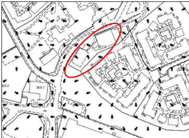
Figur 5. Riktning för dagvattenflöde (Nacka kommun, 2016)

Riktningen för dagvattenflödet kan ses i figur 5.