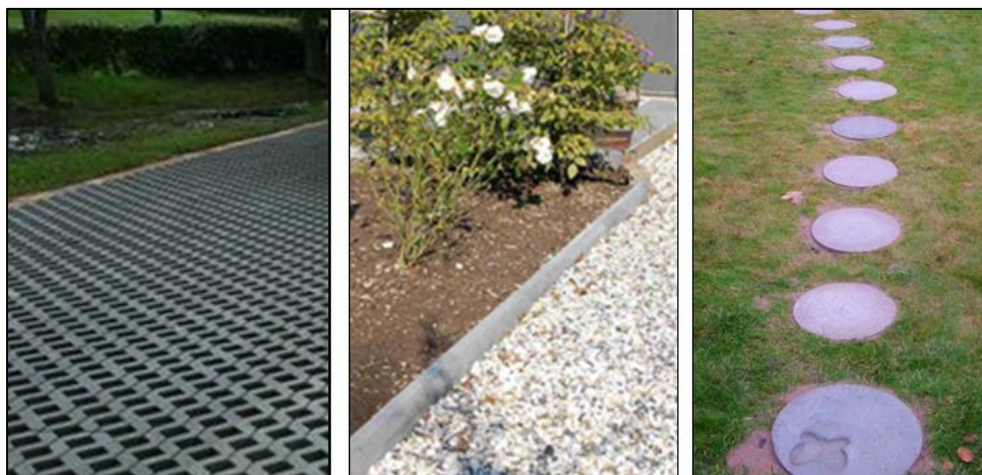
Figur 7. Yta med hålsten av betong, makadambelagd gång, samt gångstig med gräs och ett fåtal gångplattor

Även om det inte går att infiltrera dagvattnet genom underliggande material kan genomsläppliga beläggningar öka koncentrationstiden, jämfört med asfalterade ytor. Det vill säga dagvatten avrinner långsammare från genomsläppliga beläggningar än från asfalt.