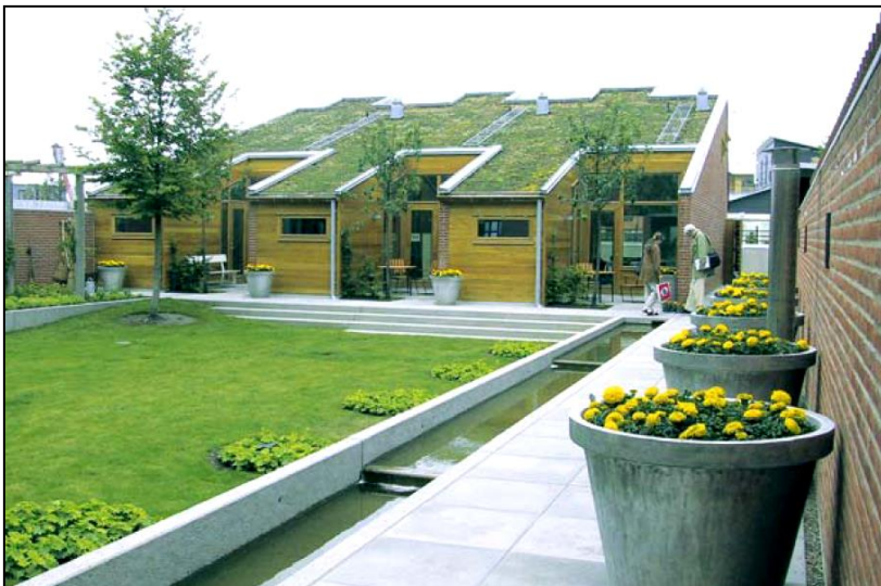
Figur 8. Bostadshus med gröna tak (Vegtech)

Förutsättningar för att tekniken skall kunna utnyttjas är att taket inte har alltför brant lutning. Takkonstruktionen skall vara dimensionerad för den extra last som det gröna taket innebär. Lasten är dock inte större än att motsvara ett vanligt tegeltak.