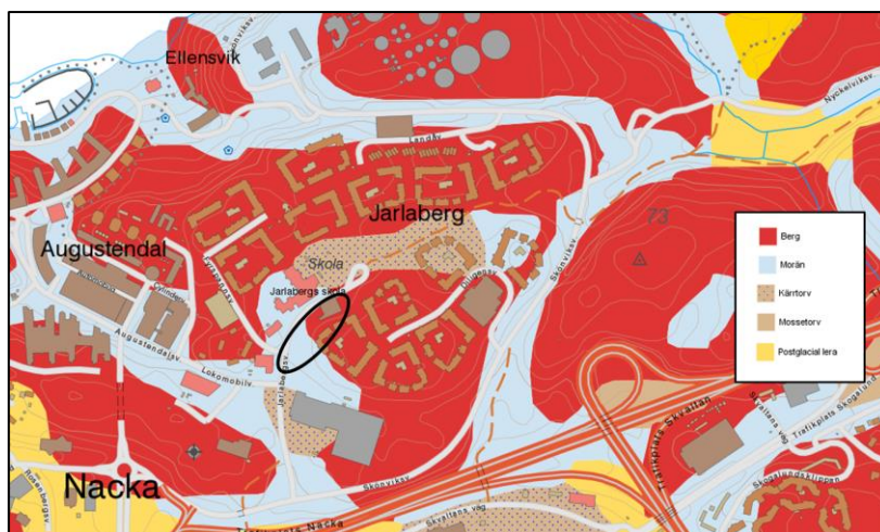
Figur 1. Jordartskarta, detaljplanområdets ungefärliga position är inringat i svart (SGU, 2016)

Detaljplanområdet ligger på ett område där det är berg i norr och morän i södra området, se figur 1. Morän har en god infiltrationsförmåga.