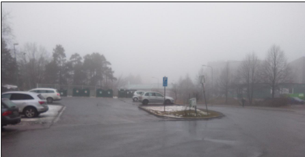
Figur 3. Parkeringsytan avrinner mot rännstensbrunn belägen vid vägkanten vid Jarlabergsvägen.

I sydöst gränsar detaljplanen till fastigheter längs Diligensvägen. Fastigheterna längs Diligensvägen 104-114 har utkastare för takvattnet och dagvattnet väntas avrinna på naturmark mot detaljplanområdet, se figur 4. Därmed inkluderas denna yta i utredningsområdet.