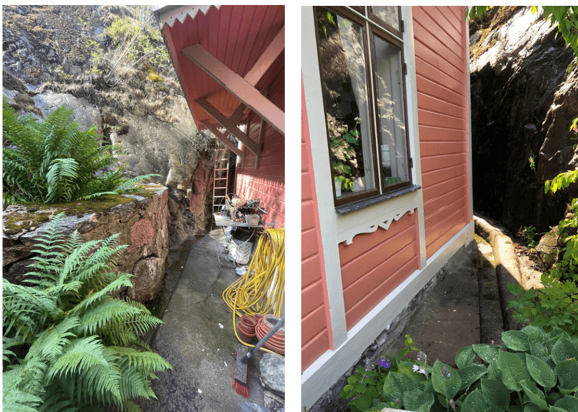
Figur 6: Dagvattensystemet invid huvudbyggnaden på fastigheten Björknäs 10:4.

Det finns ett dagvattenhanteringssystem på fastigheten, placerat bakom huset på just den plats där skyfallet får störst påverkan. Dagvattensystemet är privat och fungerar enligt nuvarande fastighetsägare bra. Dagvattnet renas genom infiltrering i marken innan det når recipienten.