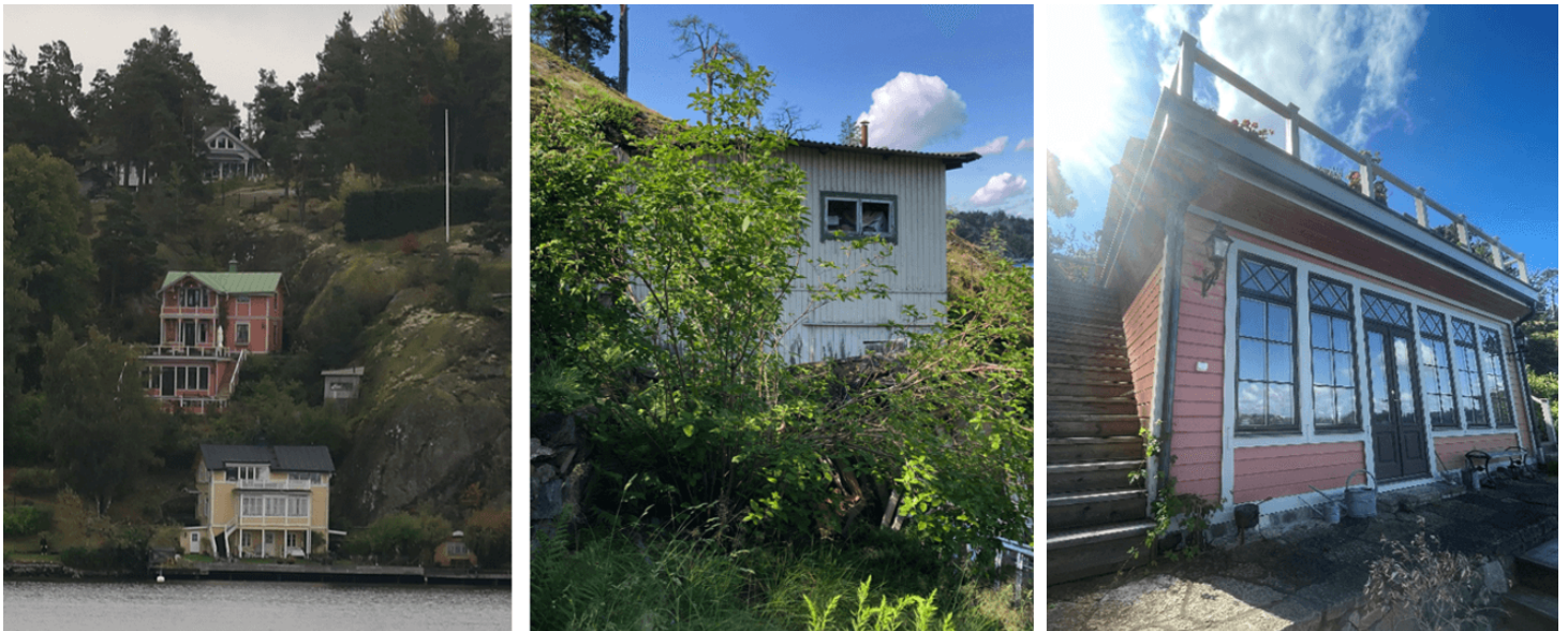
Figur 4: Komplementbyggnader på fastigheten Björknäs 10:4. I bilden till vänster visas vyn från Skurusundet. I bilden i mitten visas gästhuset. I bilden till höger visas den underbyggda altanen.

De två komplementbyggnaderna som idag finns på fastigheten Björknäs 10:4 utgörs av ett gästhus från mitten av 1900-talet, och ett utedass som troligen är byggt under 1800-talet. Båda komplementbyggnaderna är i mycket dåligt skick. Gästhuset är byggt nära fastighetsgränsen på starkt sluttande berg. Huset har vattenskador och är i behov av en total renovering. Byggrätten för gästhuset flyttades i DP 380 från sin ursprungliga placering, vilket innebär att gästhuset idag är planstridigt. Dikt an gästhuset står ett dass, som har fina detaljer men är i mycket dåligt skick. Dasset omfattas, liksom gästhuset, inte av rivningsskydd i gällande detaljplan.