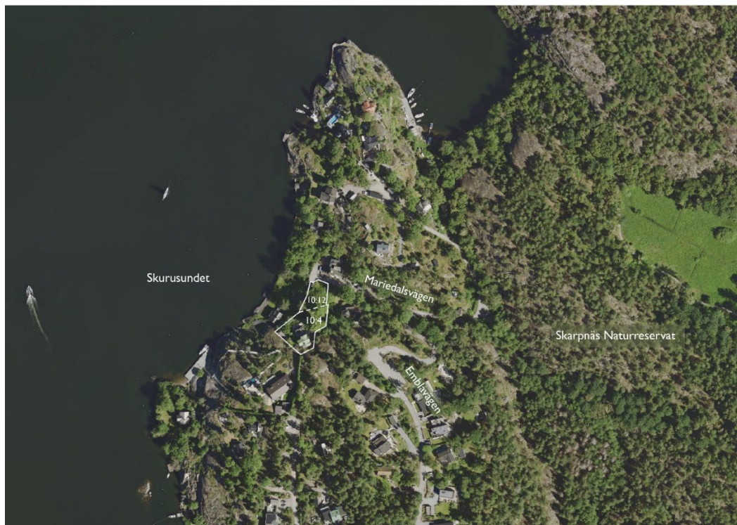
Figur 1: Bilden visar ett flygfoto över planområdet med omgivning. Vit heldragen linje anger planområdets gräns. Vit streckad linje anger gränsen mellan fastigheterna Björknäs 10:4 och 10:12 inom planområdet.

Fastigheterna Björknäs 10:4 och 10:12 är belägna i norra delen av Lilla Björknäs inom kommundelen Boo. De två fastigheterna ägs av samma fastighetsägare och utgör tillsammans en villatomt inom ett område med friliggande villor. Björknäs 10:4 är bebyggd med en huvudbyggnad och en underbyggd altan samt två komplementbyggnader. Fastigheten Björknäs 10:12 är obebyggd. Fastigheterna är totalt cirka 1400 kvadratmeter stora och utgörs av kuperad naturtomt som vetter mot Skurusundet. Fastigheterna angörs från Mariedalsvägen.