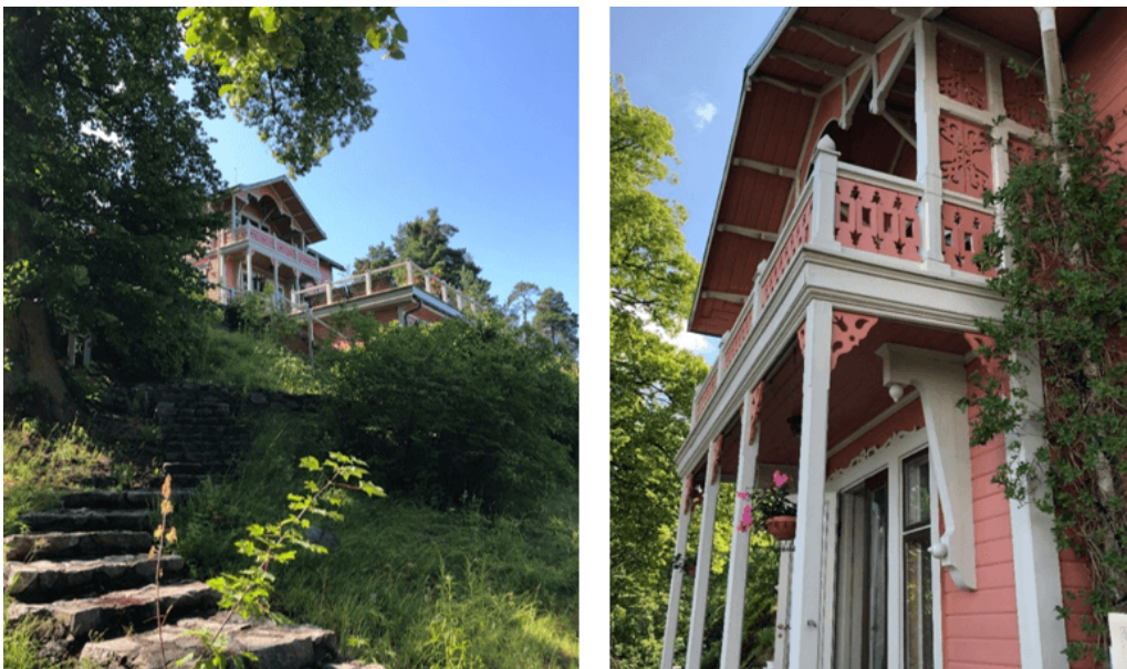
Figur 3: Huvudbyggnaden på fastigheten Björknäs 10:4. Bilderna visar huvudbyggnadens exteriör med lövsågade detaljer, samt den starka kuperingen på fastigheterna och tomtens grönskande karaktär.

Huvudbyggnaden, sommarvillan på fastigheten Björknäs 10:4, uppfördes som sommarvilla år 1884. Villan är rikt dekorerad med snickarglädje och utgör en tydlig och tidstypisk representant för ett sommarnöje i så kallad schweizerstil.