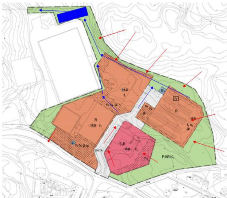
Figur 2. En grov skiss över planområdet där röda pilar indikerar tillrinnande vatten. Blå pilar markerar hur vattnet kan avledas från platsen ytledes.

Förslagsvis anläggs en dagvattendamm på den aktuella platsen. En dagvattendamm är en kostnadseffektiv reningsmetod som kan skänka stora mervärden till ett område, förutom dagvattenhantering kan en dagvattendamm bidra till ett ökat djur och växtliv i ett område. Utifrån en preliminär bedömning av platsens förutsättningar och höjdnivåerna i området är platsen lämplig för att anlägga en dagvattendamm. En tumregel är att en dagvattendamm ska dimensioneras så att ytan motsvarar 1-2 % av den reducerade arean. För det aktuella planområdet så motsvarar en yta om cirka 220 m 2 cirka 2 % av den reducerade arean. Denna dimensionering skulle innebära att cirka 50 % av den tillförda fosfor avskiljs. Den totala ytan som behöver tas i anspråk är dock större eftersom dammen kommer att behöva släntas av. Vidare kommer uppställningsytor för arbetsmaskiner för drift och underhåll av dammen att behövas.