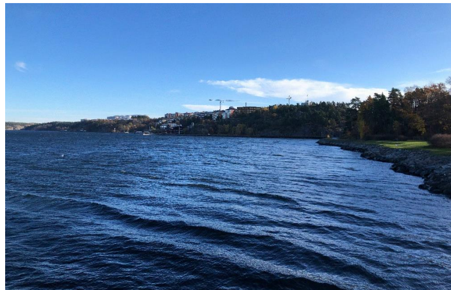
Figur 7. Fotomontage som visar vy från Kvarnholmen, västerifrån in mot planområdet. Denna vy bedöms vara den känsligaste då området tydligt präglas av ett sammanhållet skärgårdslandskap utan bebyggelse. Montaget utgår från att planförslaget innehåller en vändplan med diameter om 18 meter. En alternativ utformning kommer dock att studeras, vilket kan få en positiv inverkan på riksintresset då fler träd kan komma att sparas. Foto: AU kulturmiljö, 2023.