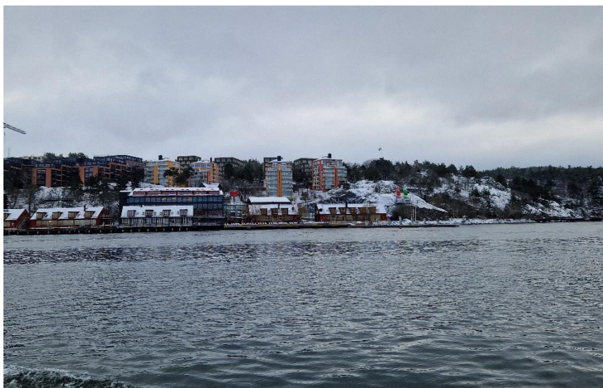
Figur 6. Fotomontage som visar vy från Blockbusudden och farleden söderut mot planområdet. Den föreslagna bebyggelsen skymtar fram bakom punkthusen.