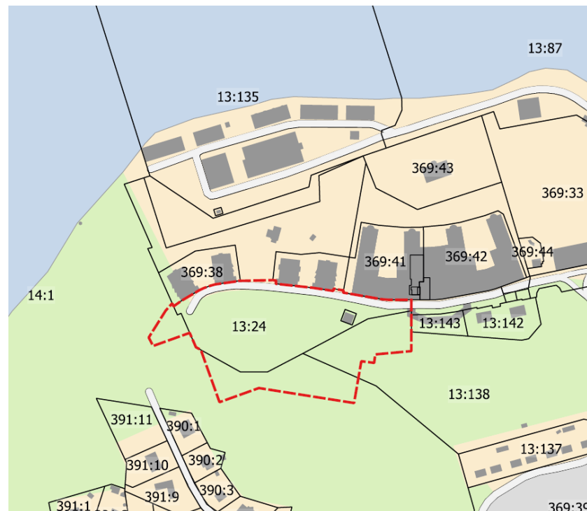
Figur 4. Karta som visar avgränsningen av planområdet för Berget.

Sett från farleden utanför Kvarnholmen minskar dominansen av skärgårdslandskapet terräng och grönska något. Bebyggelsehöjden upplevs dock som en naturlig fortsättning av både skärgårdsnaturens horisontlinje och framförvarande punkthus.