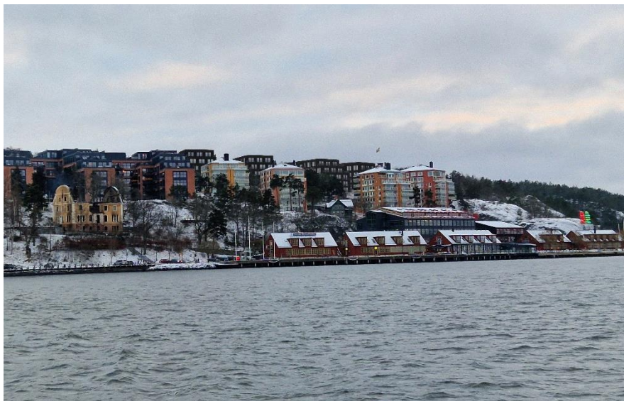
Figur 5. Fotomontage som visar vy från farleden, österifrån in mot planområdet. Här är de nya byggnaderna mer synliga. Foto: AU kulturmiljö, 2023.