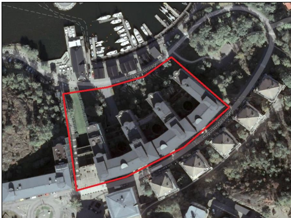
Tolkad detaljplanegräns (Översiktlig dagvattenutredning för hus 13, Sweco 2014-06-04)

Planområdet är till stor del bebyggt med det som idag är en stor kontorsbyggnad. I och med denna detaljplan tillåts bostäder där det tidigare inte funnits planstöd för detta. Planområdet ligger relativt långt från större vägar varför föroreningsbelastningen på hustaket främst har sitt ursprung i atmosfärisk deposition vilket utgör låga föroreningshalter. Enligt kommunens dagvattenstrategi kan rent dagvatten avledas direkt till recipienten. Då den södra plangränsen går i fasadliv görs bedömningen enligt Sweco ( Översiktlig dagvattenutredning för hus 13, Sweco 2014-06-04 ) att dagvattnet kan ledas till Saltsjön via befintligt ledningsnät utan föregående rening. Planens genomförande innebär därmed endast marginella förändringar på dagvattensammansättningen. Delar av taket avleds idag åt Augustendalsvägen. Så föreslås ske även i framtiden. Det innebär att detta dagvatten kommer att passera en ny dagvattenreningsdamm som ska anläggas nedströms. Detta är ur föroreningssynpunkt ej nödvändigt. Av kostnadsskäl kommer inte befintligt takvatten avledas åt annat håll varför det framöver kommer avledas till dagvattendammen. Planområdet kommer att ge en oförändrad (el marginellt mindre) belastning på vattenförekomsten Lilla Värtan.