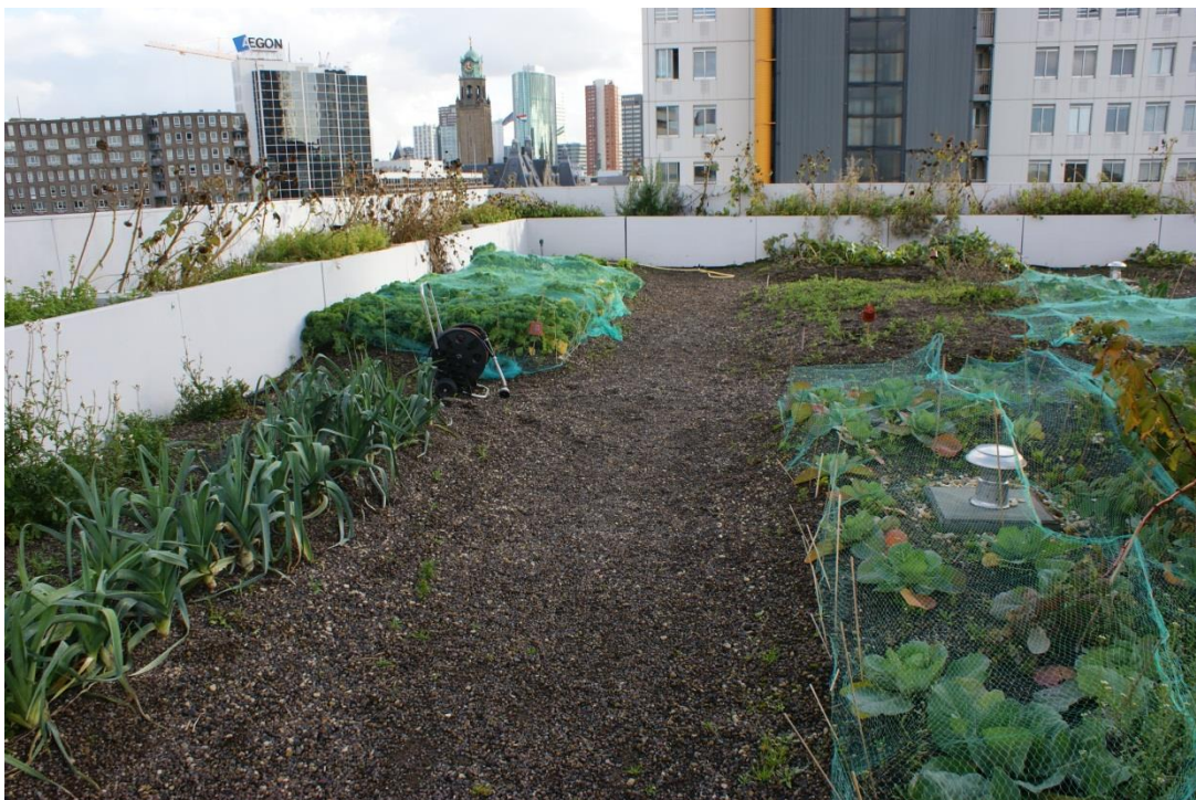
Figur 4. Exempel på grönt tak med odling.

På de platser som beskrivits ovan där växtbäddar och planteringar är möjliga föreslås även att delar av vattnet som avleds från de högre liggande taken kan ske via stuprörutkastare och rännor till dessa. I dagsläget går stuprören från taket på utsidan av väggen från de högsta taken och ner i dagvattenledningar genom huset. Dessa stuprör kan, där växtbäddar och planteringar anläggs, ledas om med utkastare och ytlig avrinning för att ge möjlighet att använda vattnet till bevattning. På bjälklag är det enligt LA risk för uttorkning och bristen på vatten är ofta ett problem. I växtbäddarna fördröjs och renas dagvattnet och kommer växterna tillgodo. I Figur 5 visas exempel på utformning av utkastare och rännor för ytlig avledning samt växtbäddar, vilka utformas som nedsänkta ytor där vegetation i form av träd, örter och gräs kan planteras.