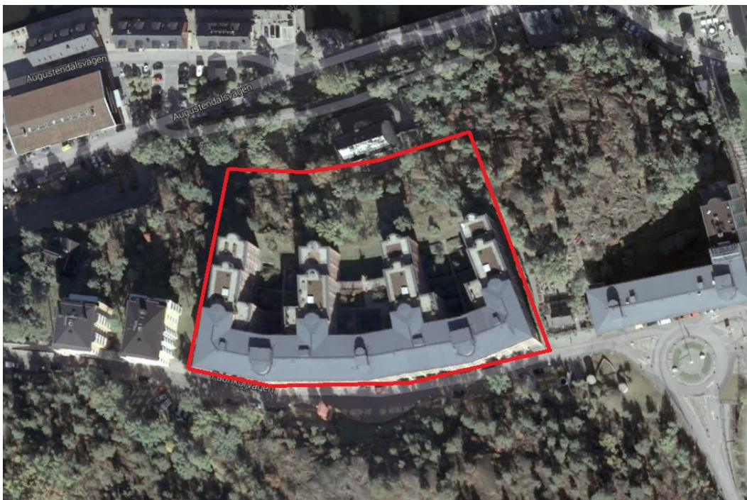
Figur 1 Flygbild med tolkade detaljplanegränser för hus 15.