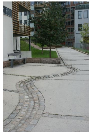
Figur 5. Exempel på utkastare och rännor kopplade till växtbädd.

Växtbädd på bjälklag bör utformas med dränerande lager och bräddbrunn för avledande av överskottsvatten vid kraftiga regn. Växtbäddarna har ett stort estetiskt värde och kan med fördel bli en del av den yttre gestaltande miljön.