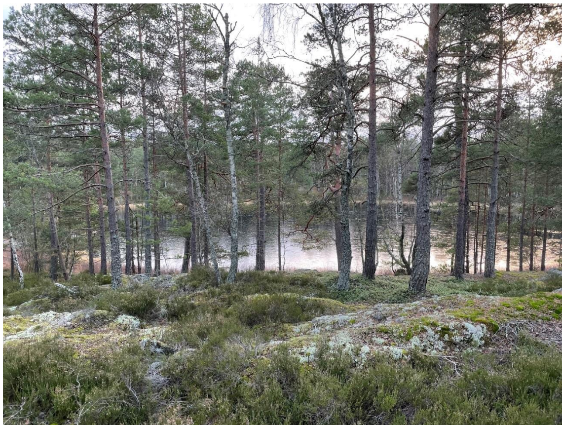
Bild 1. Hällmarker vid Krokträskan

På sluttningar och i dalar finns såväl äldre blandskog med inslag av ek, lind och andra lövträd, som lövriska bryn och sumpskogar. I buskskiktet finner man hasselbuketter och skogsolvon. Danmarks ängar slås varje år. Där finns även noteringar om förekomst av smalvingad blombock, en rödlistad skalbagge som är beroende av fuktig ängsmark. 2008 brann ett område mellan Krokträskan och Danmarks ängar. Det har gjort området till en värdefull miljö för arter som bara lever i bränd och död ved eller blottad jord eller sand.