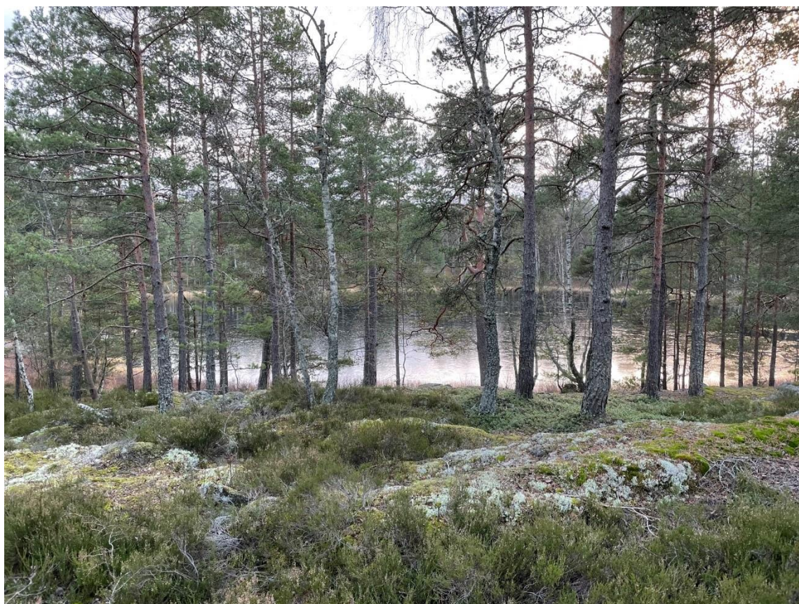
Bild 1. Hällmarker vid Krokträskan

På sluttningar och i dalar finns såväl äldre blandskog med inslag av ek, lind och andra lövträd, som lövriska bryn och sumpskogar. I buskskiktet finner man hasselbuketter och skogsolvon. Danmarks ängar slås varje år. Där finns även noteringar om förekomst av smalvingad blombeck, en rödlistad skalbagge som är beroende av fuktig ängsmark. 2008 brann ett område mellan Krokträskan och Danmarks ängar. Det har gjort området till en värdefull miljö för arter som bara lever i bränd och död ved eller blottad jord eller sand.