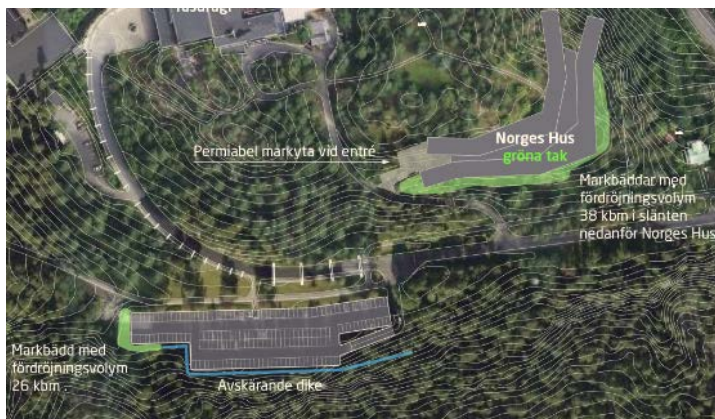
Figur 2 Ytor för hantering av dagvatten

För att nå flödeskraven, under ett 10-årsregn med en klimatfaktor på 1,2 är den nödvändiga fördröjningsvolymen i Norges Hus område 85 m 3 . Om gröna tak och permeabel beläggning utnyttjas är den nödvändiga fördröjningsvolymen 38 m 3 . Fördröjningsvolymen för parkeringshusets område är 26 m 3 .