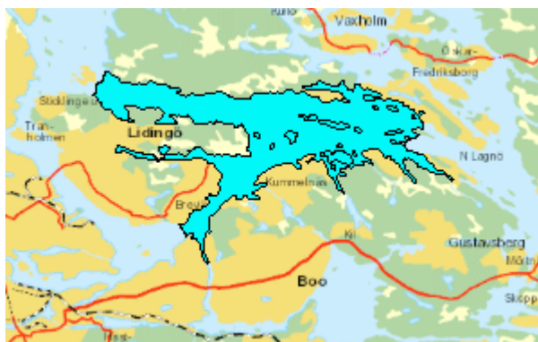
Figur 1 Askrikefjärdens ytvattenförekomst

Miljö kvalitetsnormen (MKN) för Askrikefjärden är att den ekologiska statusen ska vara god ekologisk status med tidsfrist till 2021. Enligt förslag till ny MKN är tidsfristen flyttad till 2027. Enligt det nya förslaget till MKN kommer även den kemiska ytvattenstatusen få en ny klass, och god kemisk ytvattenstatus 2015.