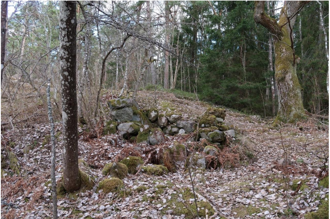
Husgrund vid Toppbyddan.