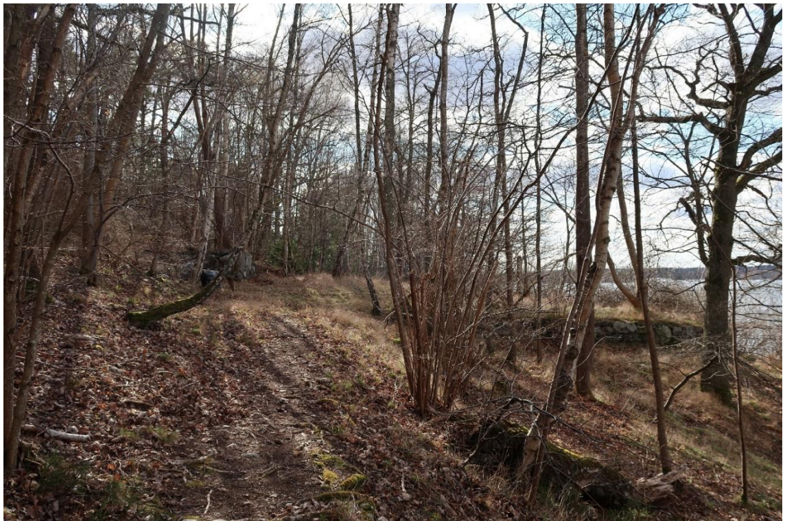
Husgrund vid Vikingsborg, vy mot väster. Den stensatta terrassen mot vattnet till höger i bild.