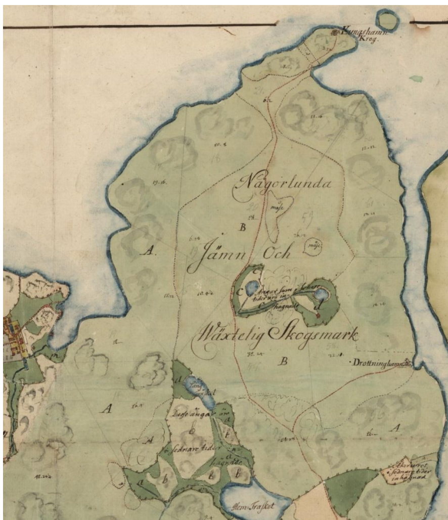
Området på kartan över Sicklaön från 1774.

Fram till slutet av 1700-talet hörde hela Sicklaön till Danviks hospital och gårdarna Stora Sickla, Järla, Skuru och Duvnäs var arrendegårdar med rätt att bruka skogen. När gårdarna sedan fick privata ägare fortsatte skogen brukas gemensamt fram till 1825 då skogsmarken delades mellan dem. På grund av sitt läge på sydostligaste Sicklaön var det omöjligt att skapa ett sammanhängande skogsskifte för Duvnäs utan att de andra gårdarna skulle påverkas negativt och därför fick gården två skiften. I Skuruområdet skapades ett större skogsskifte som i öster avgränsades till Skuru gårds, i söder till Stora Sicklas och i väster till Stora Nyckelvikens marker. På så sätt blev skogen som låg skild från gårdens inägomarker en utskog i enlighet med en äldre lantmäteriterm och senare etablerades namnet Duvnäs utskog för skogsområdet.