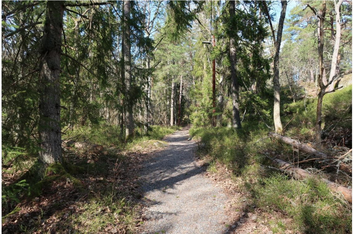
Blåbärsgranskog norr om Kärrdalen.