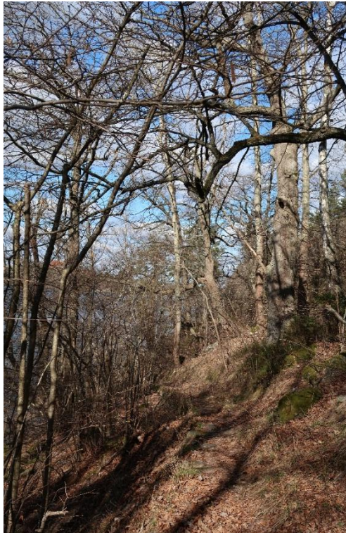
En av de stensatta gångarna ner mot vattnet. Platsen präglas av stora lövträd och hassel.