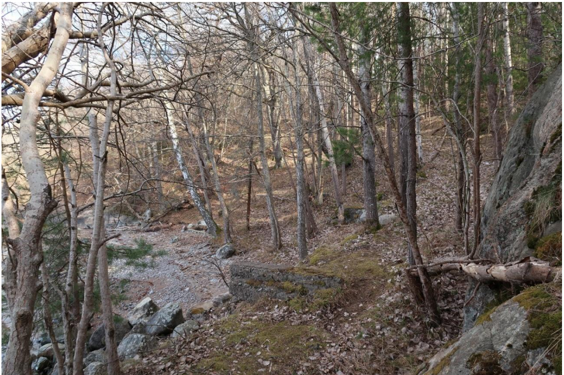
Västra stranden vid Vikingsborg, i förgrunden rester efter ångbåtsbryggan.