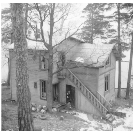
Västra, mindre sommarvillan vid Vikingsborg före rivning 1976.