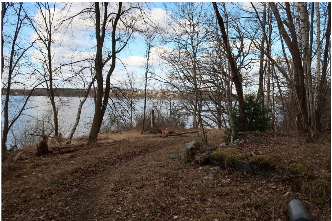
Husgrund vid Vikingsborg, vy mot nordost. Grillplatsen ligger i mitt på bild vid ett flaggståndsfundament.