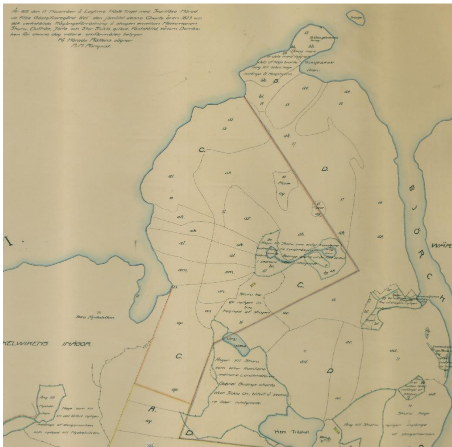
Skogsdelningskartan från 1825.

Området är lätt att känna igen på 1700-talets kartor. Kartan över Sicklaön från 1774 delar området i tre markslag, inre delen ”jämn och sidländ mark, jämväl beväxt med gran och tall” och närmare stranden ”mycket bergbunden mark, någorlunda beväxt med gran och tall”. Hela strandområdet beskrivs som ”kala berg varpå ingen skog växer”. Fram till 1800-talets slut var området obebyggd utmark. I sydost vid dagens Rudsjöparken, kommunförrådet och radhusområdet Duvnäs utskog låt ett område med inhägnade ängs- och hagmarker vilket tyder på att skogen nyttjades för skogsbyte.