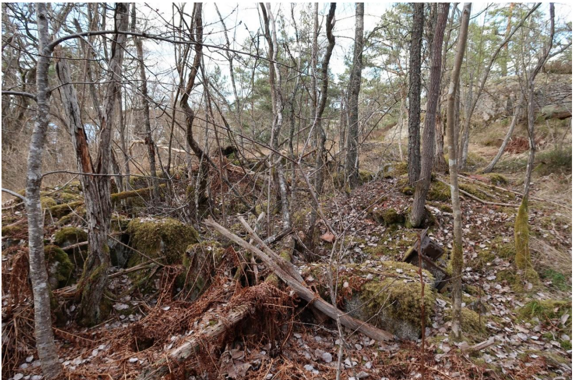
Husgrund vid Toppbyddan.