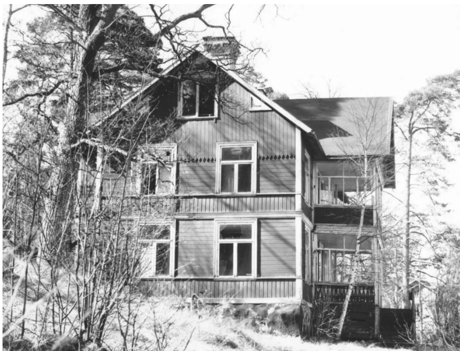
Östra, större sommarvillan vid Vikingsborg vid brandövningen 1957.

gångar. Högre upp i terrängen står ytterligare en sommarvilla, Topphyddan, längs ett stigssystem som leder söderut och ansluter till gamla vägen mellan Kungshamn och Skuru. Villorna beboddes av sommargäster till 1950-70-talet och revs därefter. Den östra villan som var en stor sommarvilla i två våningar med 10 rum, glasverandor och tillhörande uthusbyggnad brändes ner i en brandövning 1957. Den västra som var i 1 ½ våning rymde tre rum och kök i båda våningsplanen. Den revs 1976 efter att ha varit övergiven och vandaliserad i några år. Om sommarvillan Topphyddan finns inga närmare uppgifter.