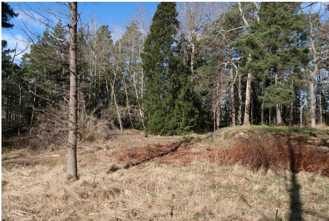
Trädgårdsväxter vid Oskarsberg.