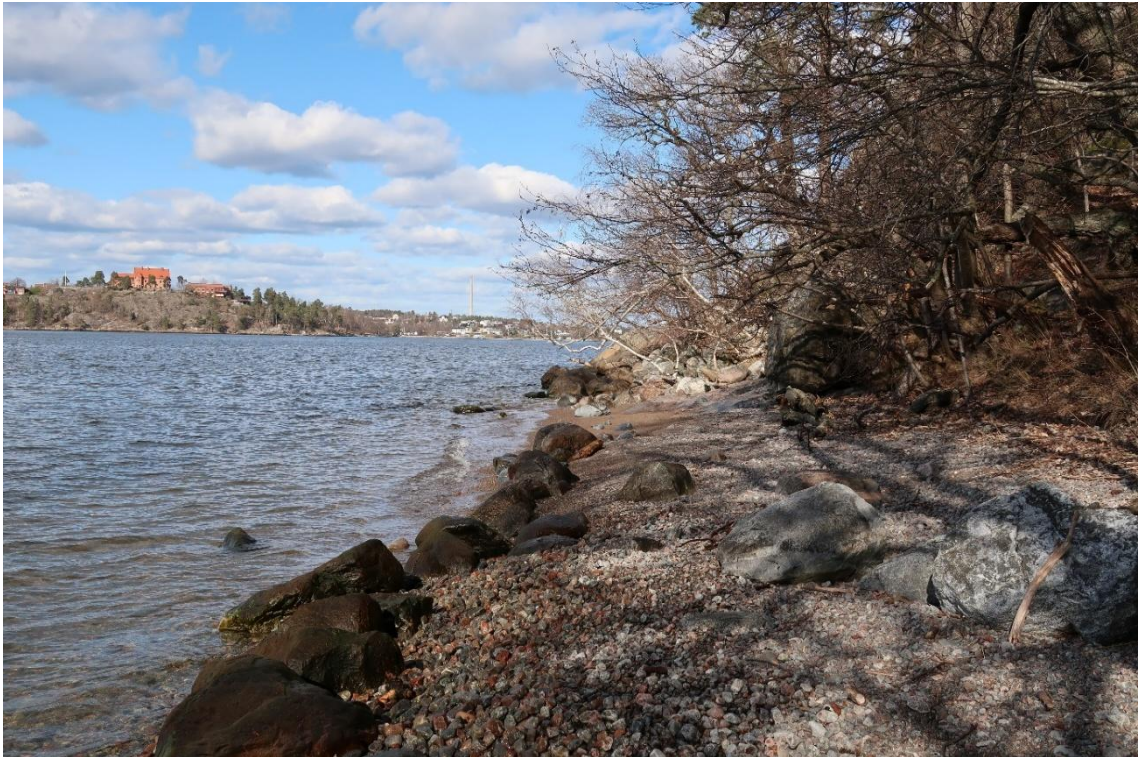
Östra stranden vid Vikingsborg.