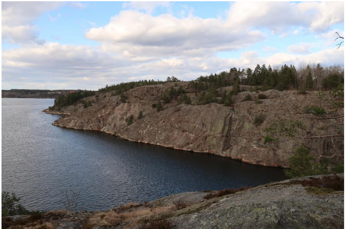
Stranden vid Oskarsberg och Kärrdalen präglas av branta klippor som stupar ner i vattnet. Vy från Vrakberget mot nordost.