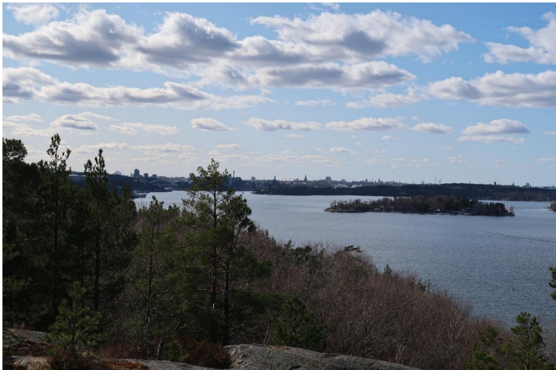
Vy från hällmarksskogens topp mot Stockholm.