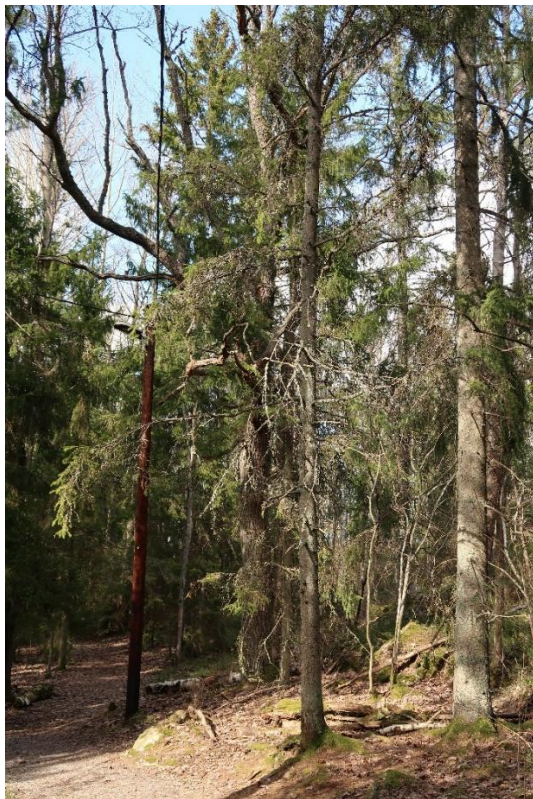
Intryckt stor ek norr om Kärrdalen.