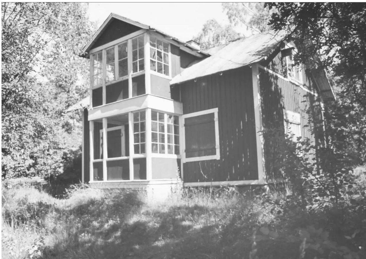
Sommarvillan Oskarsberg före rivning 1957.

Oskarsberg var en mindre sommarvilla i 1 ½ våning som uppfördes på 1870-80-talet i ett högt läge intill en klippa med utsikt mot Nyckelviken. Villan revs i slutet av 1950-talet efter skadegörelse. Även vid Oskarsberg fanns en mindre odlingsyta som idag används som en fotbollsplan.