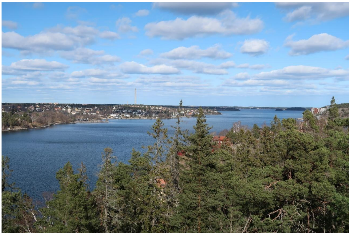
Hällmarksskogen. i de norra delarna av området erbjuder fina utsiktsmöjligheter över vattnet mot väster, norr och öster. Vy mot öster.