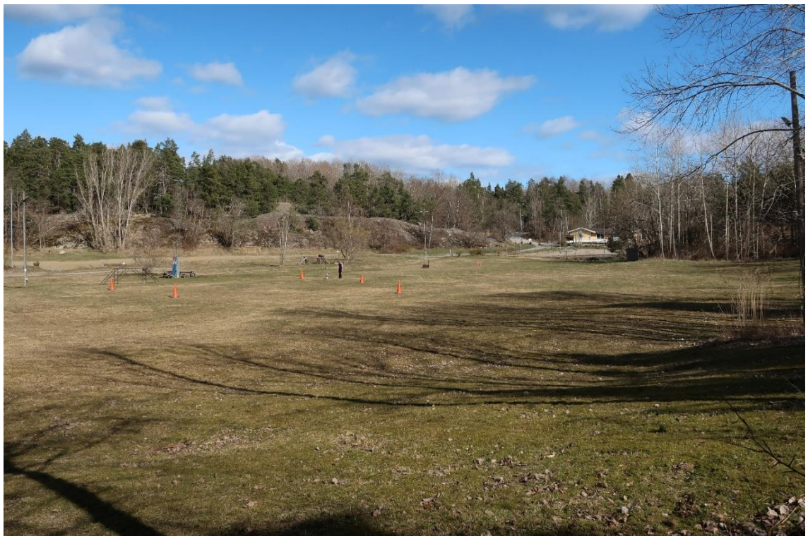
Formerna av det äldre odlingslandskapet är fortfarande avläsbara.