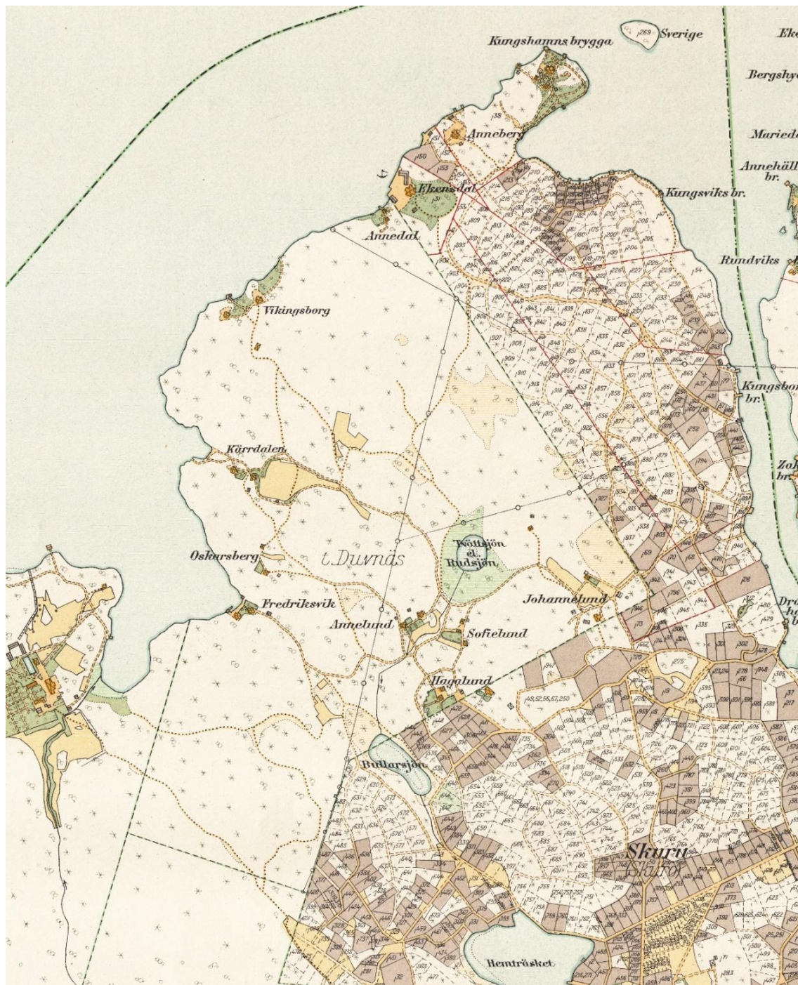
Duvnäs utskog med villabebyggelsen enligt Plankarta över Stockholms stad med omnejd från 1923.

Bebyggelse uppfördes även i södra delen av området där markerna var något flackare och låg i anslutning till äldre ängs- och hagmarker. Kärrdalen var en mindre gård eller torp med två byggnader i anslutning till en trädgård. Även Kärrdalen anlades på 1870-80-talet. Här fanns möjligheter till odling och till stället hörde två mindre åkerytor. Bebyggelsen revs på 1950-60-talet och platsen