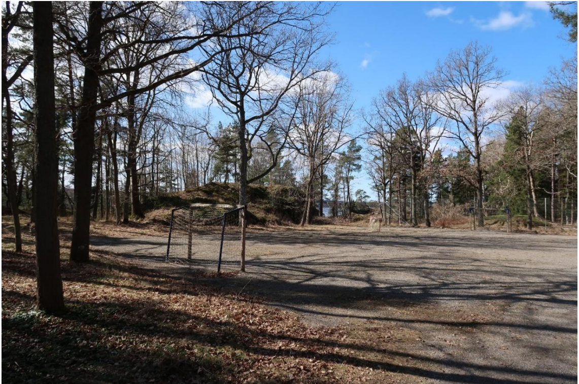
Oskarsbergs äldre odlingsmarker används idag som bollplan.