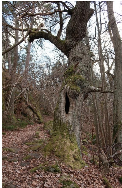
Gammal ek vid stigen mellan Toppnyddan och Vikingsborg.