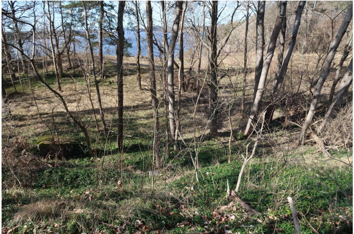
Rester efter bebyggelsen i Kärrdalen med vintergröna som marktäckare.