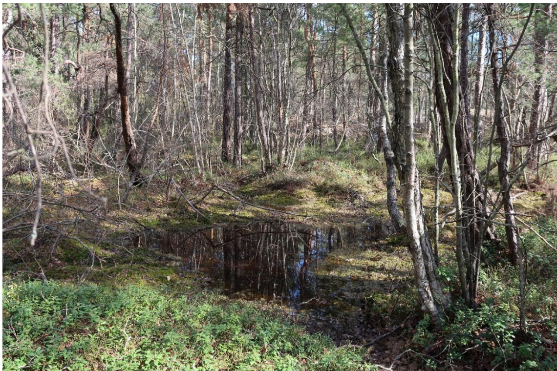
En mindre vattenansamling på hällmarken.