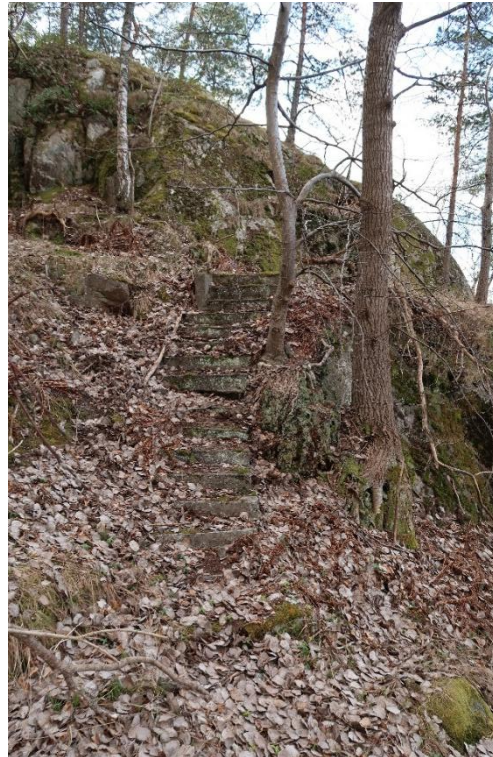
Trappa upp till en stensatt utsiktsplats.