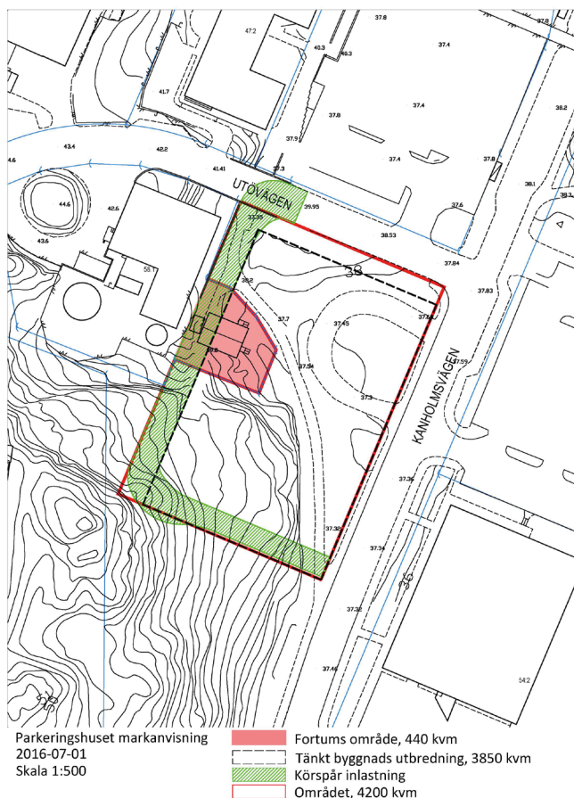
Bild över markanvisningsområdet. Markanvisningsområdet är markerat med rött och bebyggelseområde med svartstreckad linje. Grönmarkerat område visar tänkt yta för varustransporter, se mer under Trafik.

Markanvisningen kommer att ske för ett markområde som är på ca 4 700 m 2 . Av denna yta får kommande bebyggelse ta upp ett område på ca 3 900 m 2 . Dessa siffror är preliminära och kan komma att ändras under detaljplaneprocessen. Skillnaden beror på att bebyggelsen måste hålla ett visst avstånd mot angränsande panncentral samt ligga i linje med panncentralens fasad ut mot Utövägen. En förutsättning för detta är att del av fastigheten Orminge 58:1, ägd av Fortum, ska ingå i området för Parkeringshuset. Detta löses i detaljplaneprocessen.