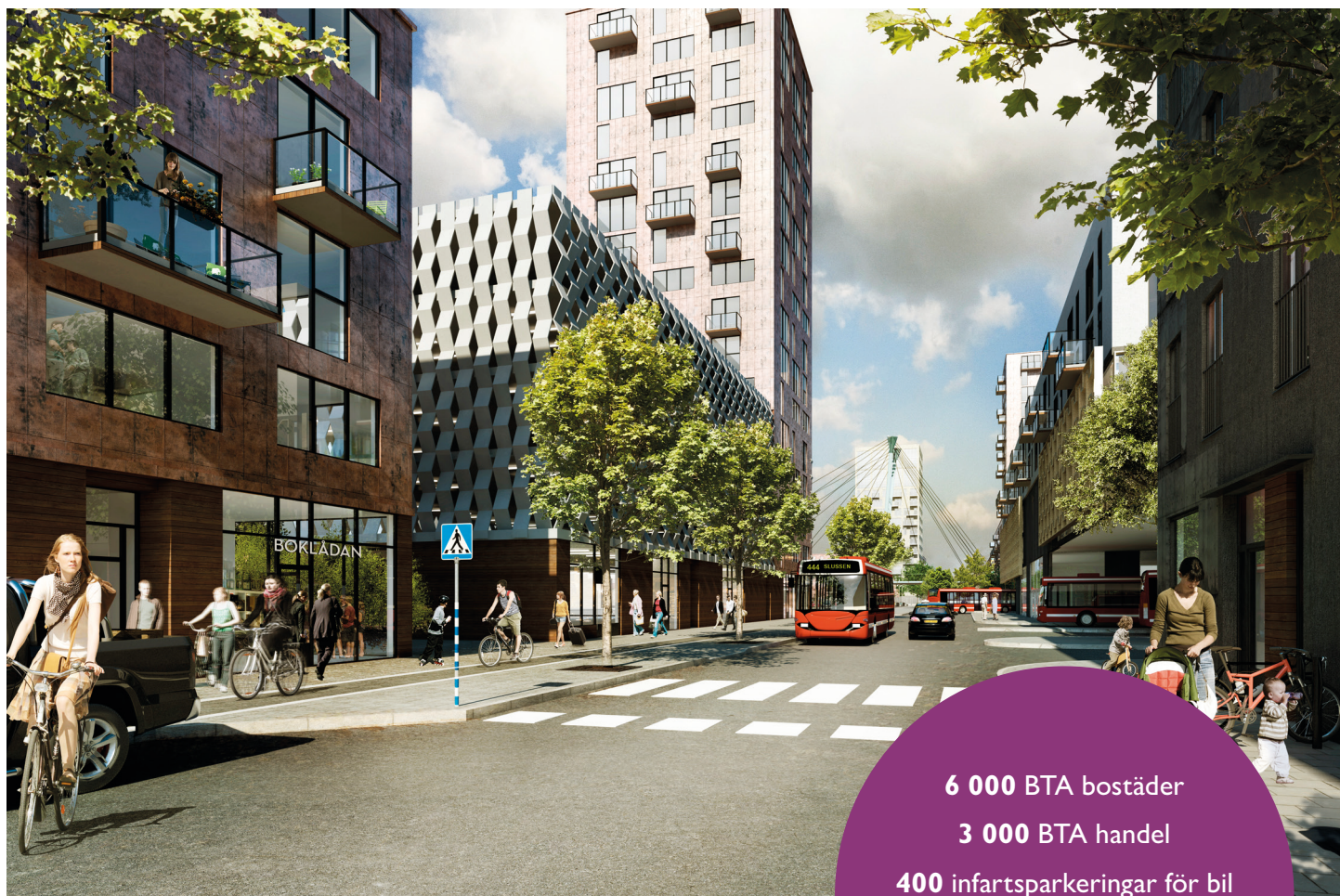
Idébild/illustration från detaljplaneprogrammet: Kanholmsvägen norrut. Bild Nacka kommun/White arkitekter.