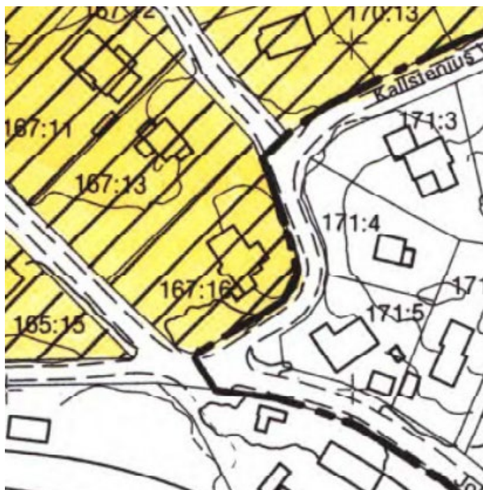
Utsnitt ur områdesbestämmelse OB1, som visar fastigheten Sicklaön 167:16.

Denna ändring av del av områdesbestämmelse kommer inom ändringsområdet gälla tillsammans med underliggande områdesbestämmelse OB 1.