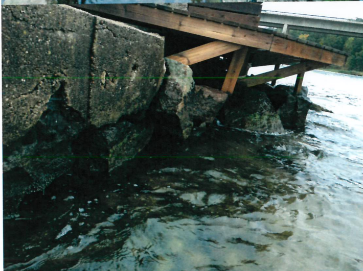
Trä stöder direkt mot sten