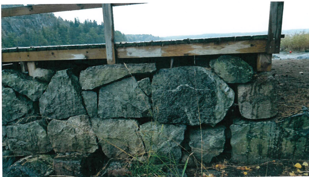
Infästningar utgörs delvis av äldre rostiga järn