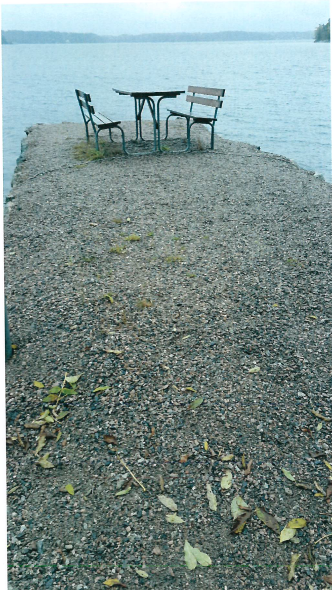
Överbygganden av grus är intakt. Inga urspolningshål eller svackor