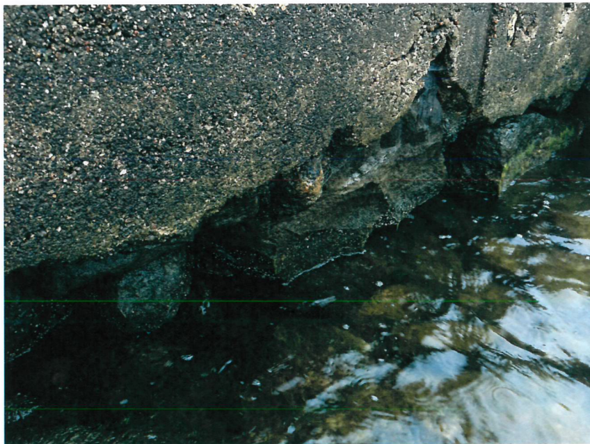
Material under framkant brygga delvis eroderat