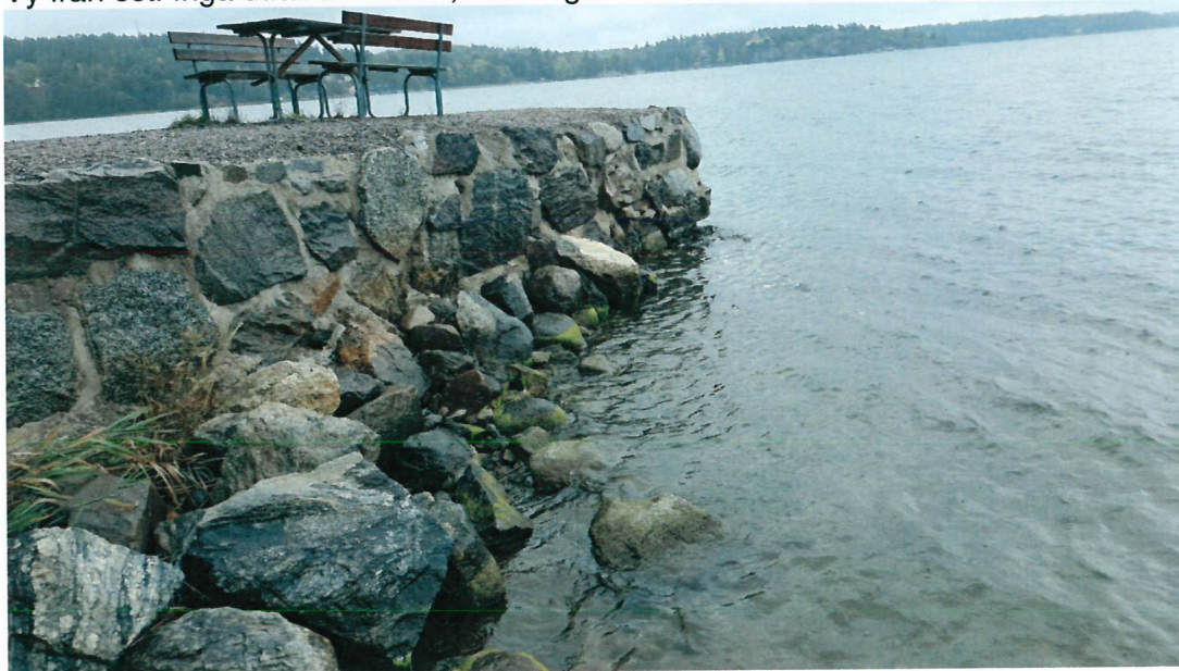
Vy från väst. Inga utfall av stenar, murningen ser ok ut