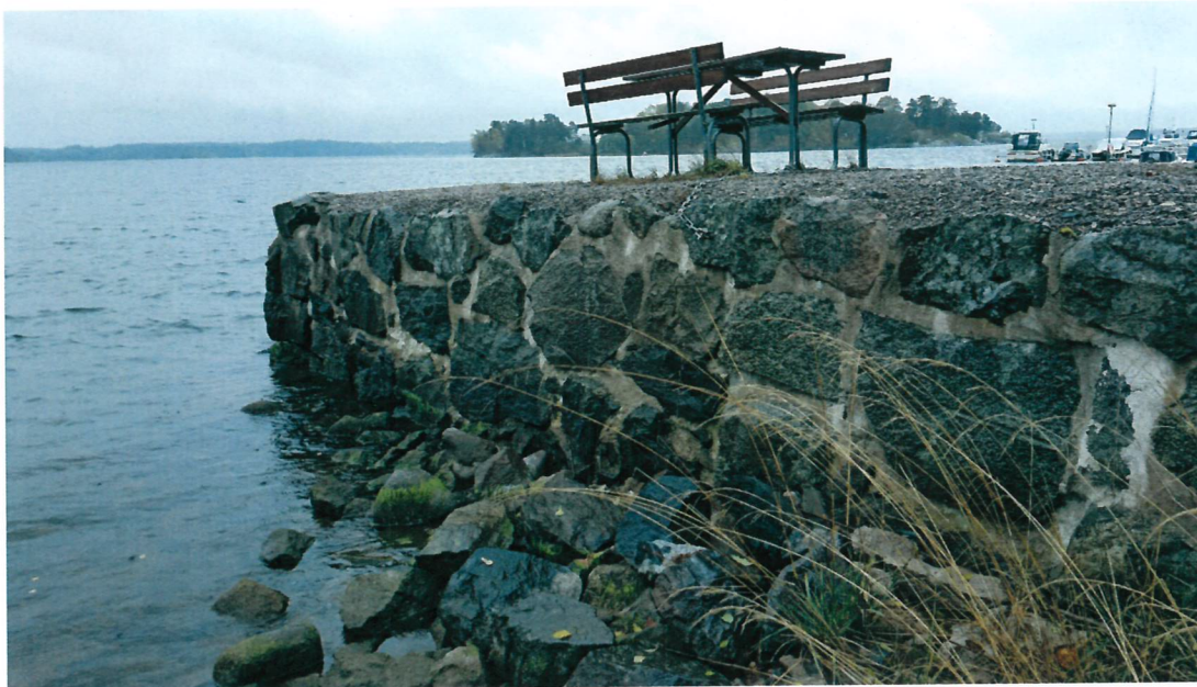
Vy från öst. Inga utfall av stenar, murningen ser ok ut