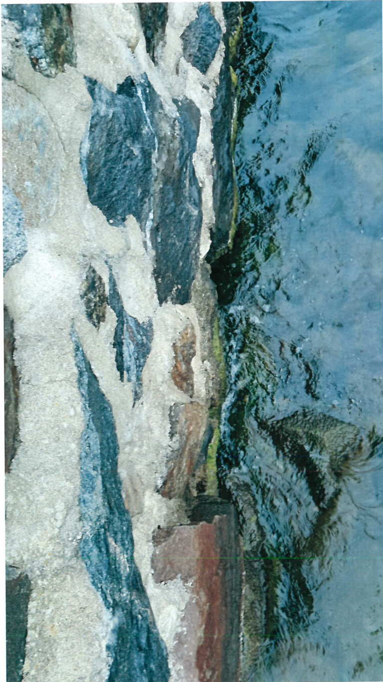
Dito andra sidan