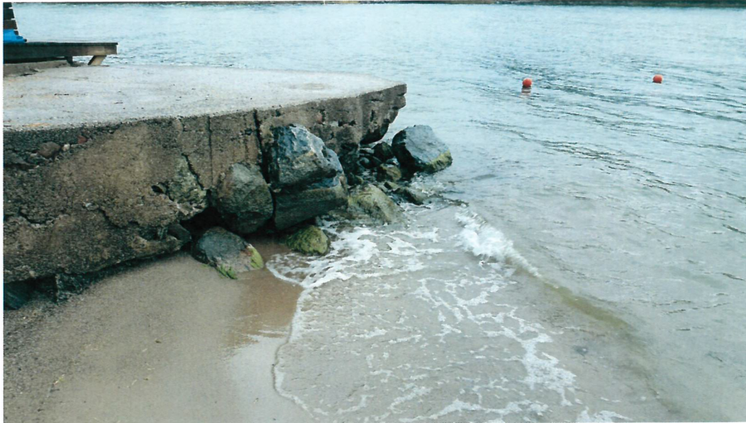
Framkanten på betongbryggan saknar stöd