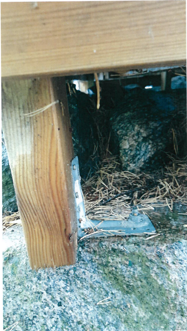
Finns även yngre infästningar av typ spikbleck, ej galvat