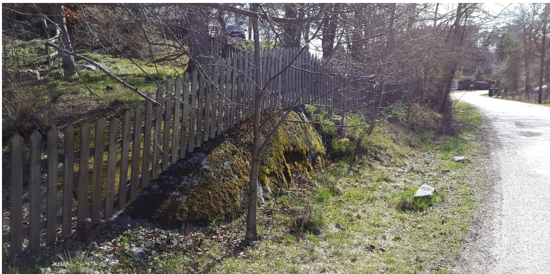
Figur 9. Baggensviksvägen, platsbesök 160421