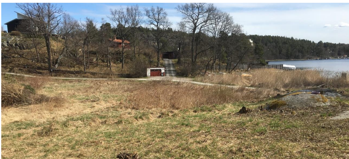
Figur 22. Grönområde, platsbesök 160421

Grönområdet är beläget i områdets sydöstra del och avgränsas i syd och väst av Boo Strandväg och av Fiskebovägen i öst. Området befinner sig i en dalgång där nivåskillnaden varierar mellan +0 och +4. Stora delar är gräsbevuxet och området används idag som bland annat lekplats. I områdets östra kant förekommer vass och i dess sydöstra hörn återfinns berg i dagen, se Figur 22.