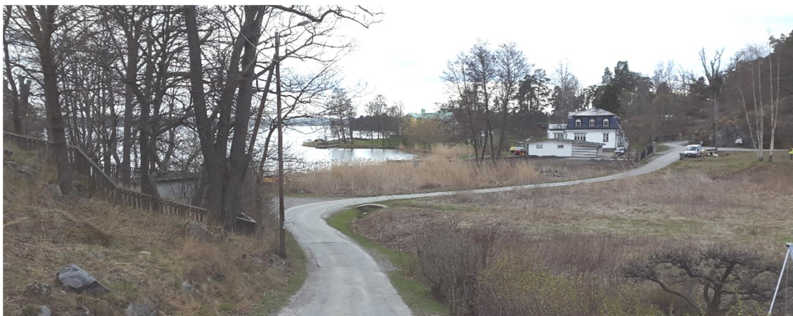
Figur 16. Grönområde, platsbesök 160421

Fiskebovägen är drygt 300 m lång och utgår från Boo strandväg. Vid vägens södra ände ligger ett flackt och sakt grönområde där det bland annat växer vass, se Figur 16. Vägen är belägen på nivåer mellan +1 och +10