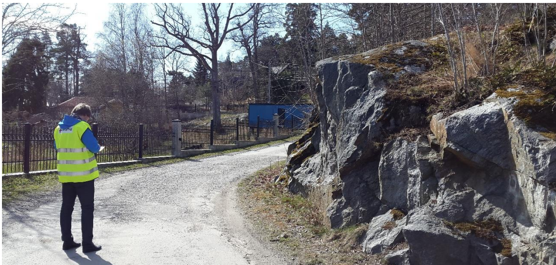
Figur 13. Korsning Boo strandväg/Fiskebovägen, platsbesök 160421

Vid 0/740 ändrar Boo strandväg riktning, bort från vattnet, och går vidare längs ett grönområde. I anslutning till grönområdet är omgivningen flack och inga tecken på berg i dagen, sten eller block syns, se Figur 14, med undantag från grönområdets sydöstra hörn, där berg i dagen återfinns.