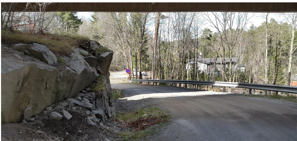
Figur 20. Kustvägen, platsbesök 160421

Kustvägen har sin start söder om Värmdöleden för att sedan passera under denna i form av en tunnel. Vägen går parallellt med strandkanten och är ca 250 m lång med nivåer mellan +8 och +13. Då vägen passerar Värmdöleden har bergsprängning fått vidtas, se Figur 20. Längs vägen kan berg i dagen samt block och sten ses.