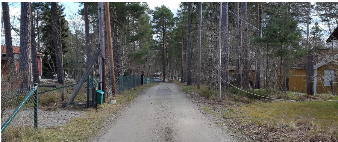
Figur 21. Grankottsvägen, platsbesök 160421