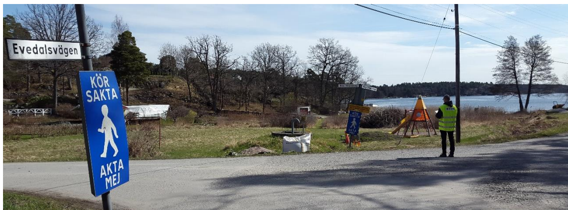
Figur 14. Grönområde, platsbesök 160421.

Vid 0/740 ändrar Boo strandväg riktning, bort från vattnet, och går vidare längs ett grönområde. I anslutning till grönområdet är omgivningen flack och inga tecken på berg i dagen, sten eller block syns, se Figur 14, med undantag från grönområdets sydöstra hörn, där berg i dagen återfinns.