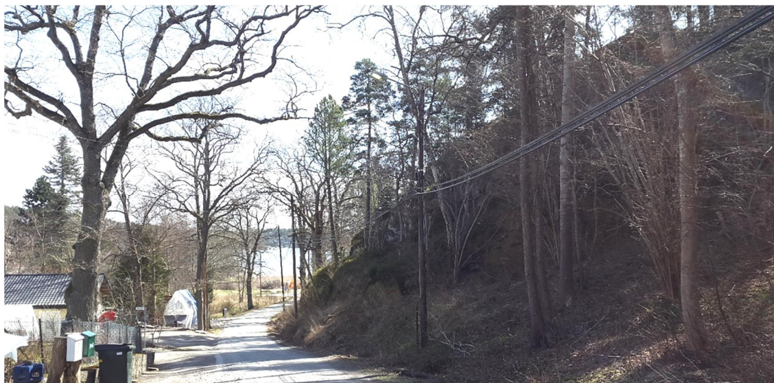
Figur 5. Bergvägg vid 16SC024, platsbesök 160421