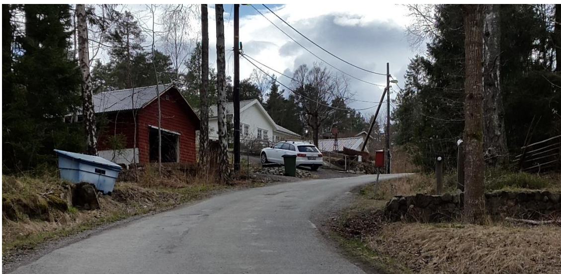
Figur 3. Lillsvängen, platsbesök 160421