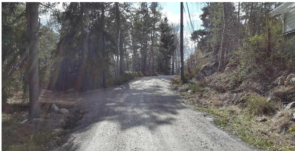
Figur 6. Solbrinken, platsbesök 160421

Solbrinken sträcker sig i en nordlig riktning från Gustavsviksvägen med nivåer mellan +30 och +50. Med start från vägens södra ände stiger vägen fram till 0/190. Längs med denna stäcka syns bitvis sprängsten och berg i dagen intill vägen, se Figur 6. Vägen omges av träd och villor längs vägens norra sida. Efter 0/190 flackar vägen ut något för att sedan slutta nedför. Öster om vägen, vid 16SC071, återfinns en kulle med synliga block. Vid 0/480 förekommer villor öster om vägen. Vid 0/400 korsar Solbrinken Evedalsvägen och fortsätter ytterligare drygt 100 m. Vägen går här i brant stigning och berget syns på flera ställen på båda sidor vägen.