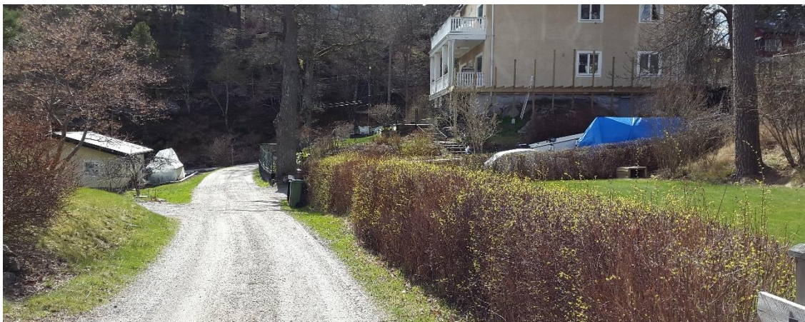
Figur 17. Uppstigen, platsbesök 160421