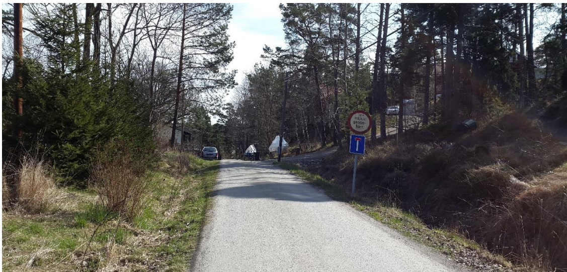
Figur 11. Ekbackavägen, platsbesök 160421