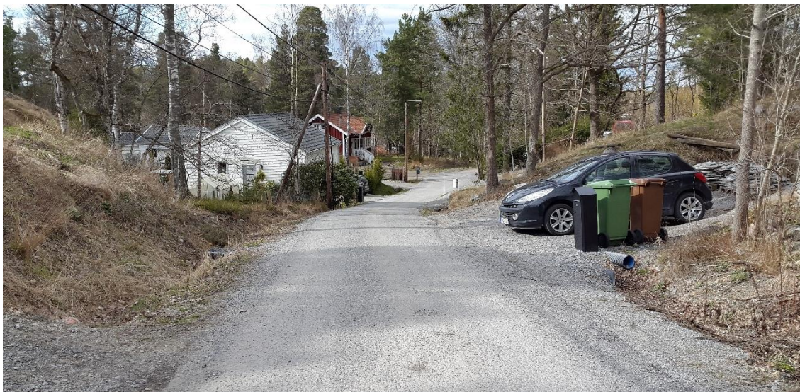
Figur 7. Perstorpsvägen, platsbesök 160421