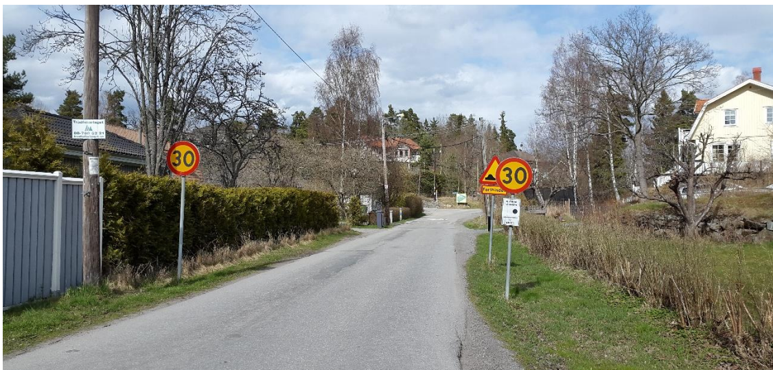
Figur 2. Ringleksvägen, platsbesök 160421

Vägsträckan längs Ringleksvägen är ca 250 m och går från Gustavsviksvägen i väst till Evedalsvägen i öst och har tre mindre anslutande vägar. Vägen stiger svagt mot öst med nivåer mellan +33 och +35 och är längs hela sträckan omgiven av villor, se Figur 2. På vissa platser kan berg i dagen ses i direkt anslutning till vägen.