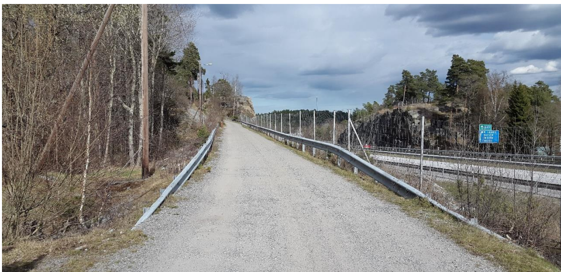
Figur 8. Grusbrinken, platsbesök 160421

Grusbrinken är en ca 200 m återvändsgata som utgår från Perstorpsvägen i en östlig riktning med nivåer mellan +32 och +39. Vägen går i bank längs med Värmdöleden i östlig riktning, se Figur 8. Längs vägens södra sida går Värmdöleden och längs den norra sidan återfinns skogsmark och berg i dagen. Omgivningen sluttar uppför i nordlig riktning.