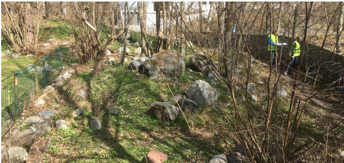
Figur 18. Område för planerad ny väg, platsbesök 160421

I slutet av Uppstigen planeras ca 50 m ny väg för att binda ihop Uppstigen med Boo Strandväg. Sträckan består i dag av skogsmark med både träd, sten och block, se Figur 18, och är belägen på ca +15. Berg i dagen kan ses i anslutning till området.