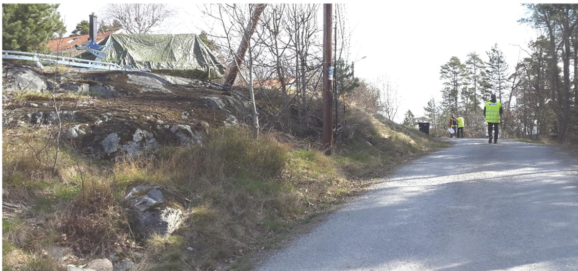
Figur 12. Rosbrinken, platsbesök 160421

Rosbrinken är en ca 300 m lång väg som är fristående från andra vägar i projektet och belägen på nivåer mellan +26 och +39. Vägen sträcker sig i östlig riktning med början från Gustavsviksvägen. Vägens västra hälft går i uppförsläge i östlig riktning medan den östra hälften sluttar nedåt med en omgivning som sluttar uppåt mot norr. Berg i dagen återfinns längs hela vägen och kring vägen syns mycket block och sten från tidigare sprängning inom området, se Figur 12.