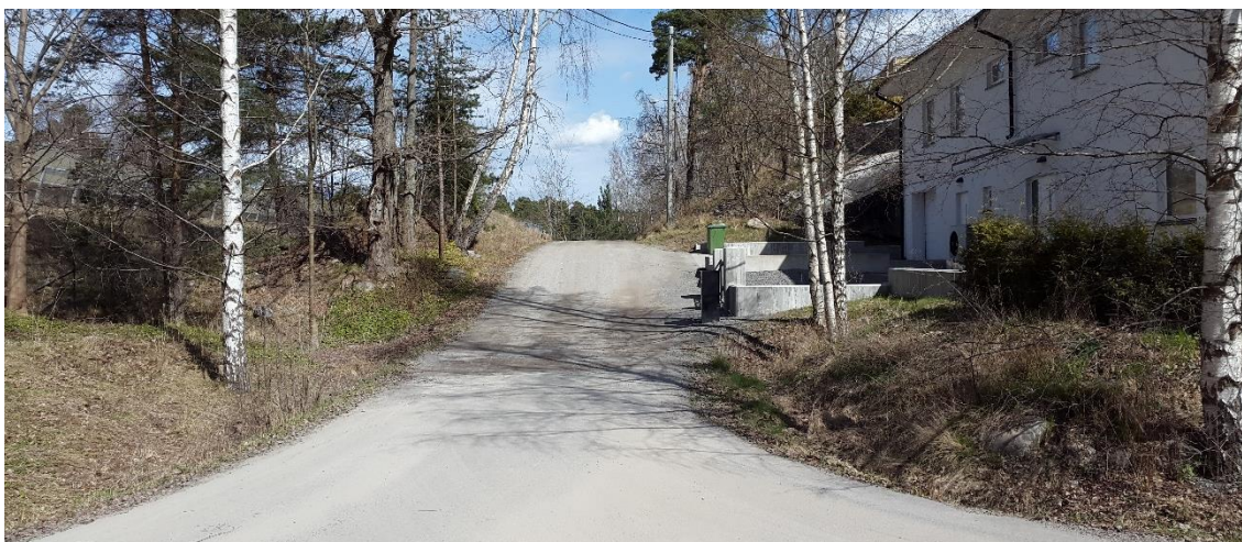
Figur 19. Brunnsbacken, platsbesök 160421