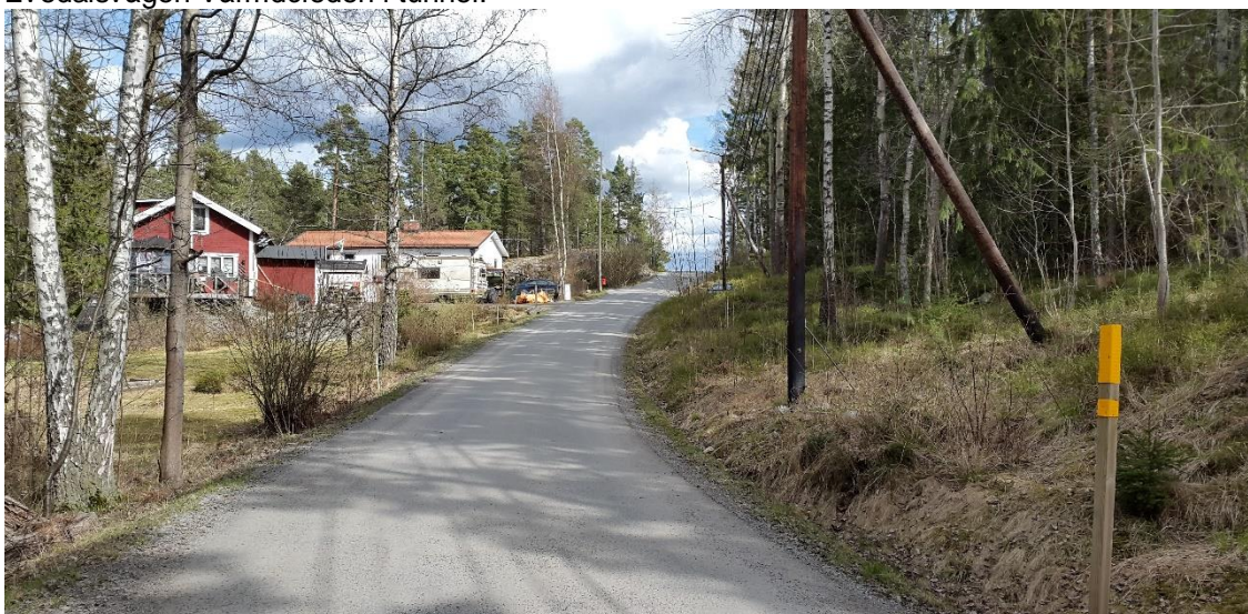
Figur 4. Ca 100 m från Evedalsvägens västra ände, platsbesök 160421

Evedalsvägen är ca 1 km lång och sträcker sig från Ringleksvägen i väst till Boo Strandväg i öst med nivåer mellan +5 och +42 med start vid den västra änden stiger vägen åt öst fram till 0/290. I början av sträckan består omgivningen av skog med sluttning mot norr för att senare ersättas av byggnader, se Figur 4. Vid sträckans högsta punkt, ca 10 meter öst om 0/290, syns berg i dagen intill vägen. Mellan ca 0/290-0/400 sluttar vägen i östlig riktning tills den korsar Solbrinken. Längs denna delsträcka kan berg i dagen ses i nära anslutning till vägen. Efter 0/400 planar vägen ut och berg i dagen återfinns intill vägen. Strax innan 0630 korsar Evedalsvägen Värmdöleden i tunnel.