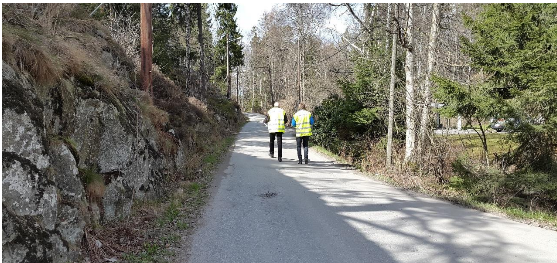
Figur 15. Boo strandväg norr om tunnelpassagen, platsbesök 160421