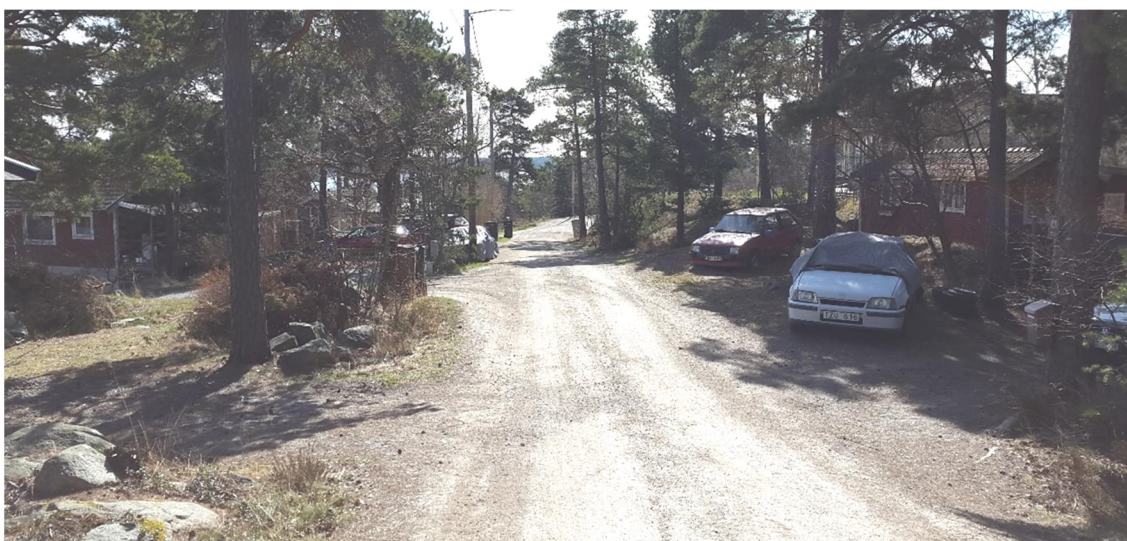
Figur 10. Hällbrinken, platsbesök 160421

Hällbrinken är en återvändsgata på ca 200 m med nivåer mellan +30 och +39. Vägen utgår från Baggensviksvägen och går upp mot höjden i öst. Omgivningen sluttar något uppför i nordlig riktning och berg i dagen syns längs hela vägsträckan, se Figur 10.