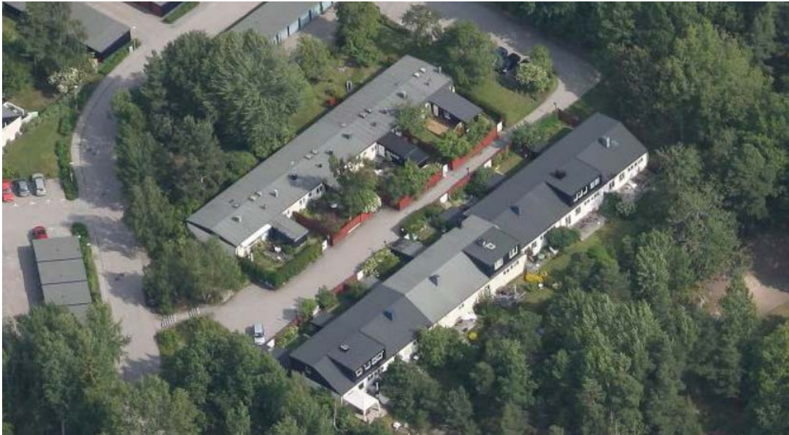
Befintlig bebyggelse med 1 våning respektive 1 våning med inredd vind där vissa fastigheter byggt takkupor.

Då syftet med planens två typer av radhus har varit att ge möjlighet till olika lägenhetsstorlekar och utbyggnadsmöjligheter bedömer Miljö- och stadsbyggnadsnämnden att det är lämpligt att ta bort bestämmelsen om vind och ändra bestämmelsen om 1 våning och vind så att det blir möjligt att bygga ut till två våningar för berörda fastigheter. På så vis blir befintlig bebyggelse planenlig och för de hus som ännu inte har byggt ut den övre våningen blir detta möjligt att göra.