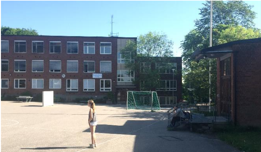
Svindersviks skola, vy från söder