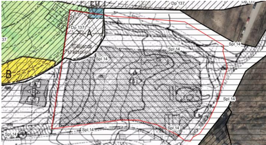
Gällande detaljplaner som omfattar Sicklaön 87:1. Röd linje motsvarar föreslagen plangräns.

plantering. För nordvästra hörnet av fastigheten gäller detaljplan 137 som vann laga kraft den 19 januari 1966. Denna anger ett underjordiskt reservat för Österleden.