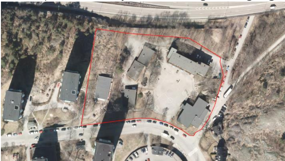
Röd linje motsvarar föreslagen plangräns samt fastighetsgräns för Sicklaön 87:1