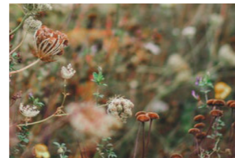
BLOMSTERÄNG I SLÄNT