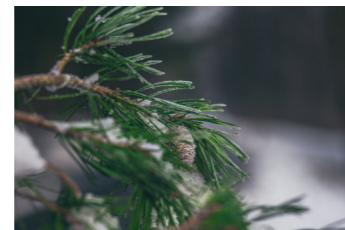
GRUPPER AV TRÄD