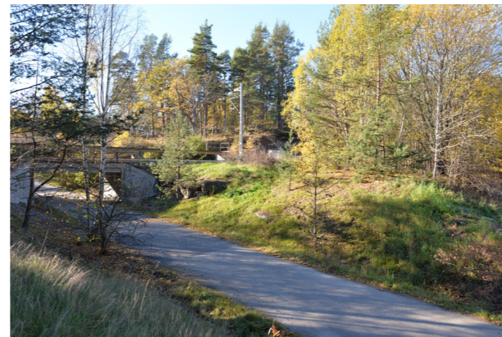
Bild som visar platsen där den nya rampen upp till plattformen kommer att placeras. På bilden syns också den befintliga vegetationen på banvallen som vuxit fram med tiden.

På denna bild syns den tydliga uppdelningen mellan den vegetationsklädda banvallen, den klippta gräsytan och skogspartiet. Gestaltningen syftar till att skapa ett mjukare möte mellan dessa.