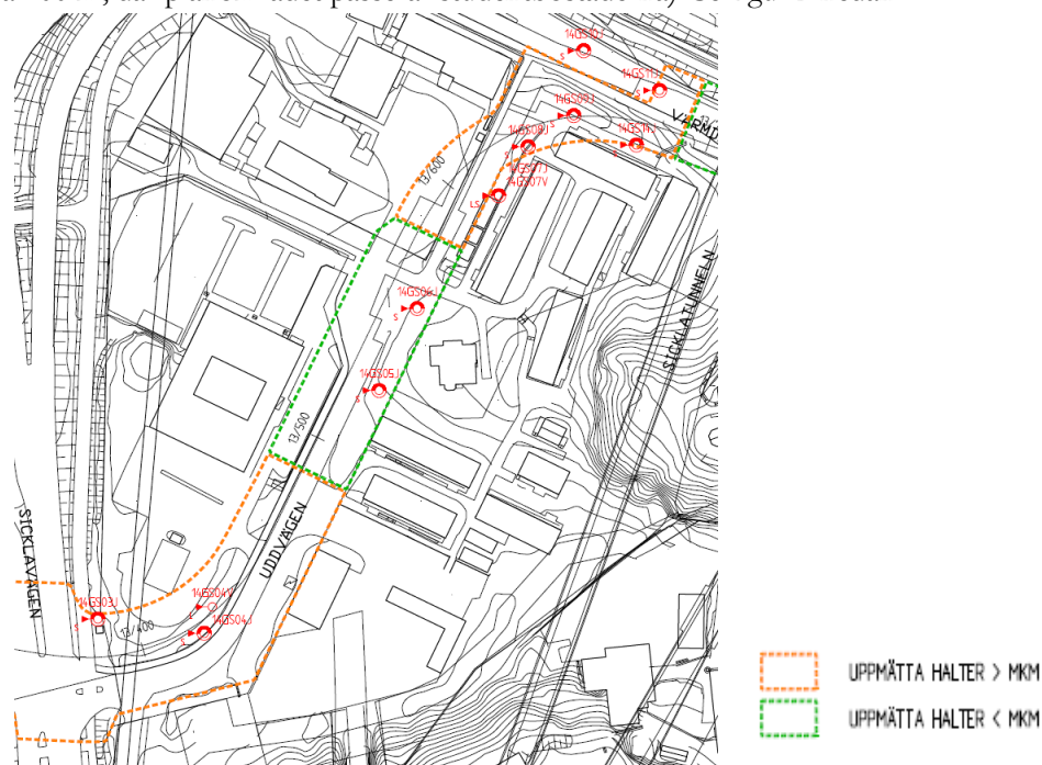
Figur 2 Placering av provtagningspunkter och bedömd förorenad mark inom delar av detaljplanområdet

Föroreningarna är koncentrerade till två områden, vid korsningen Sicklavägen/Uddvägen (ca 100m in på Uddvägen) och där planområdet svänger österut för att sedan gå parallellt med Värmdövägen (området är ca 100 m, där planområdet passerar studentbostäderna). Se figur 2 nedan.