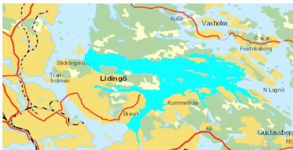
Figur 1 Askrikefjärdens utbredning.

Recipient för avrinningen är Askrikefjärdens vattenförekomst. Huvuddelen av tillrinningen till Askrikefjärden kommer från Mälaren, via Saltsjön och Lilla Värtan. De