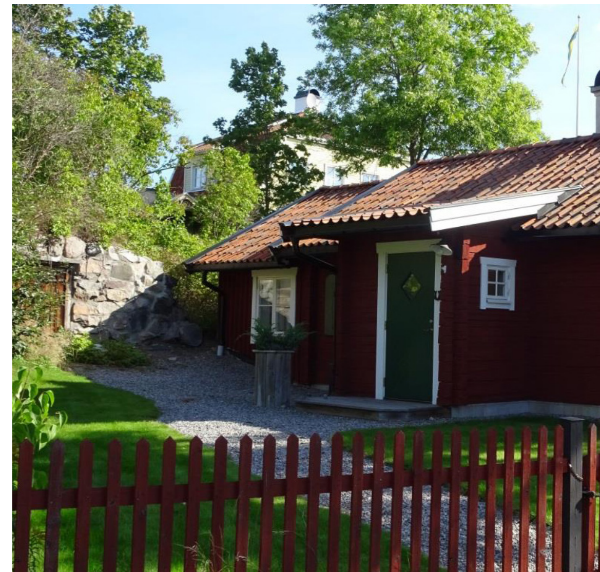
under bebyggelseinventeringen