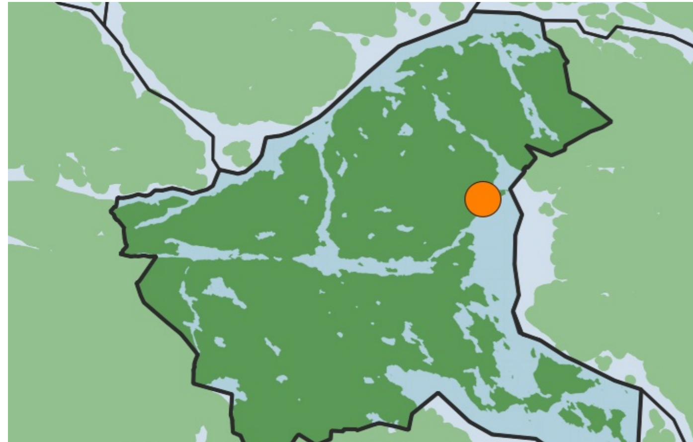
Planområdets läge i Nacka