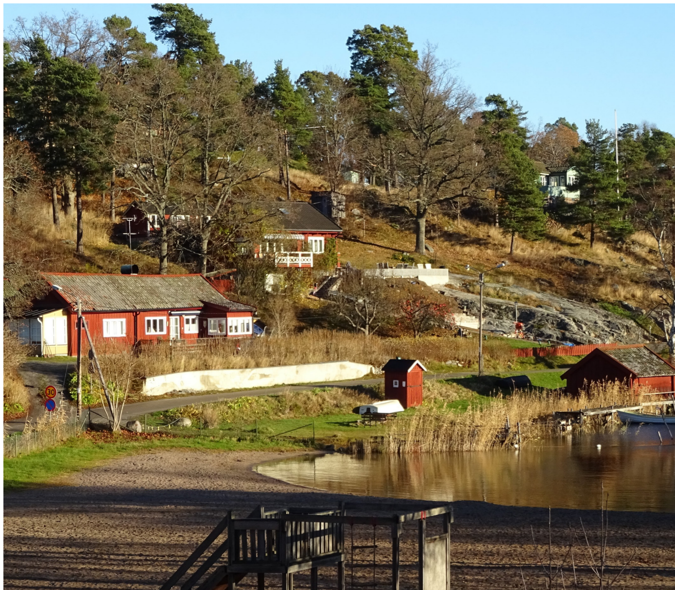
Boobadet strax söder om planområdet