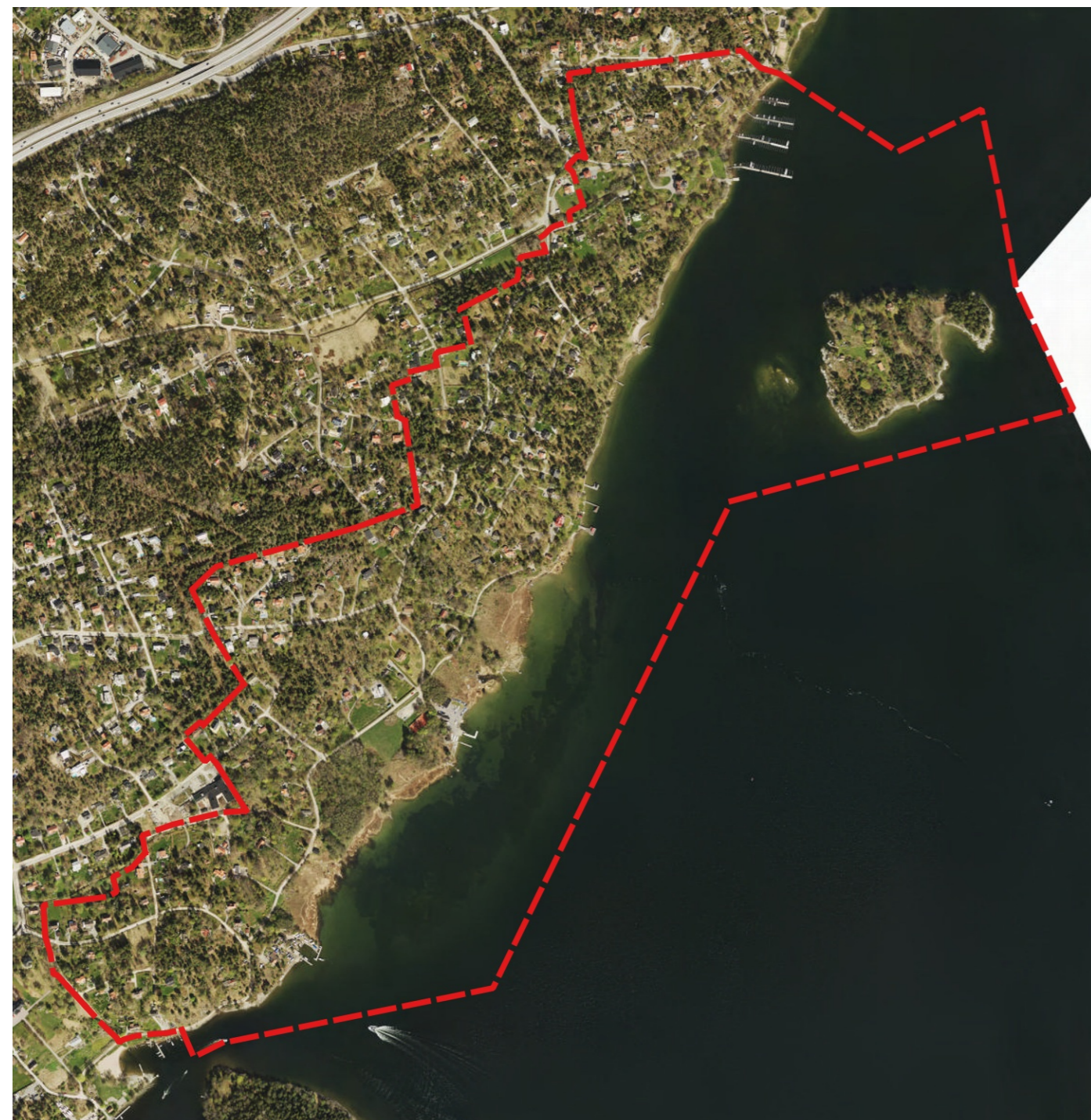
Området idag med plangräns

Mjölkudden-Gustavsviks gård är en av detaljplanerna i Sydöstra Boo. Sydöstra Boo planerades som ett fritidshusområde. Allt fler har valt att bosätta sig permanent här vilket bland annat innebär att behovet av goda kommunikationer och service ökar. Detaljplanläggning pågår därför i fem olika områden. Det övergripande planprogrammet, som antogs våren 2012, ligger till grund för detaljplanerna. Kommunen samordnar de olika detaljplanerna för att möjliggöra och underlätta genomförandet av utbyggnad av vägar, vatten och avlopp. Läs mer på www.nacka.se/sydostra-boo .