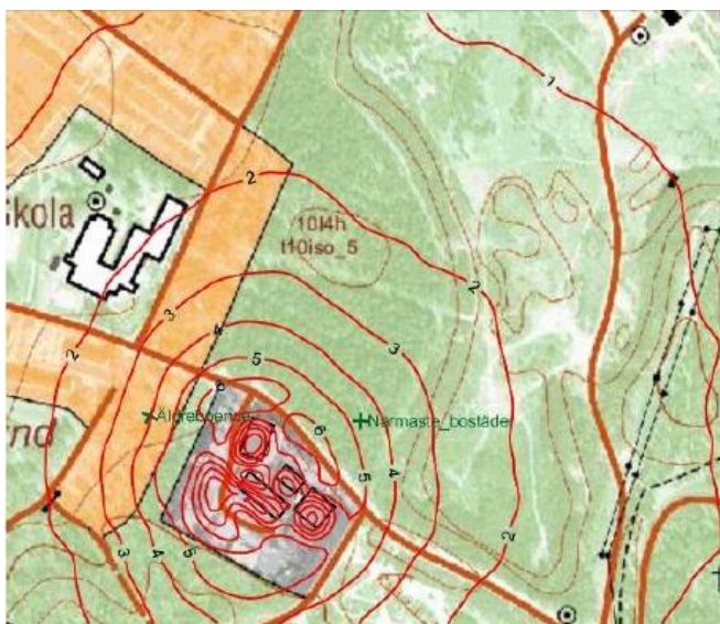
Figur 1. Här redovisas det beräknade haltbidraget av väteklorid som 98-percentil för timmedelvärden under ett år vid maximalt tillståndsgiven produktion. Enhet: \mu\text{g}/\text{m}^3 .

Slutsats: Gällande miljö kvalitetsnormer för luft kommer att klaras inom detaljplanområdet.