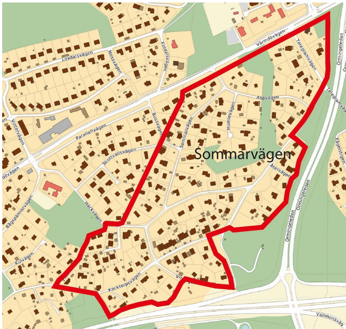
Figur 4. Preliminär utbredning av detaljplanen, (Nacka kommun, 2026).

Befintliga grönområden avses bekräftas i detaljplan som allmän plats Natur och eventuell värdefull vegetation på enskilda fastigheter kan skyddas där det bedöms lämpligt.