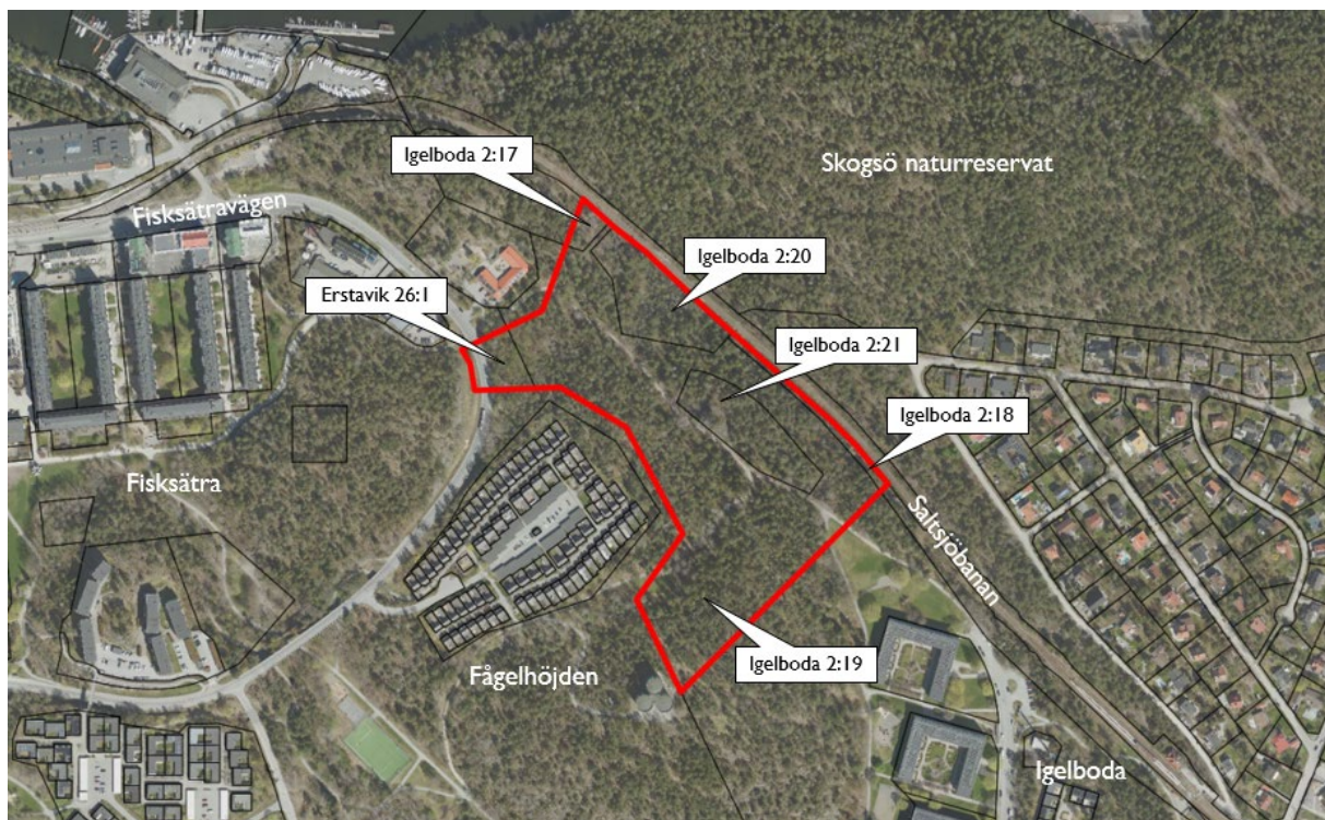
Figur 1. Kartan visar ett flygfoto över planområdet och de fastigheter som omfattas. Röd linje anger gräns för upphävande av gällande stadsplan. Svart linje anger fastighetsgränser.

Planområdet är beläget inom ett grönområde mellan Fisksätra och Igelboda, och angränsar till Saltsjöbanan och Skogsö naturreservat. Planområdet omfattar de kommunägda fastigheterna Igelboda 2:20 och Igelboda 2:21, samt del av fastigheterna Igelboda 2:17, 2:18 och 2:19 samt Erstavik 26:1. Planområdet utgör totalt cirka 6,4 hektar.