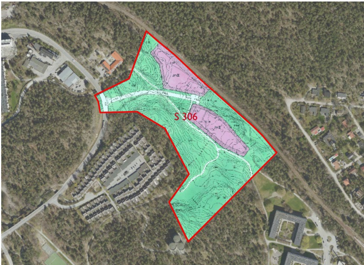
Figur 2. Kartbilden visar gällande stadsplan S 306.

Detta upphävande innebär att ovan beskriven plan upphävs i sin helhet, och området blir därmed planlöst.