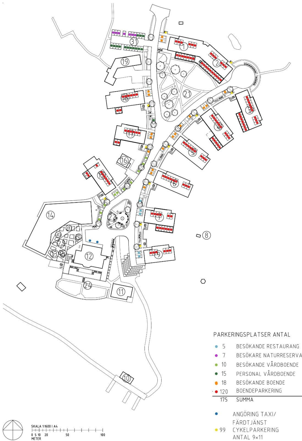
Bild 1: Korrigerad illustration till planbeskrivning och gestaltningsprogram.