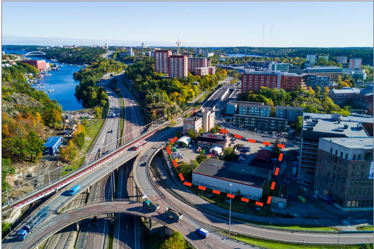
Flygfotot visar projektområdets geografiska läge, röd linje markerar projektets preliminära avgränsning.

Fastigheten Sicklaön 82:1 ägs av Nacka Port AB. Direkt angränsande fastigheter som kan komma att beröras av projektet är Sicklaön 83:27 och Sicklaön 83:3 som båda ägs Trafikverket.