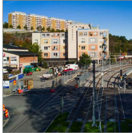
Ovanstående bild visar färgfabriken Klintens fasad mot söder, tärbanans spår i förgrunden och Henriksdalsringen i bakgrunden.

Fastigheten ligger inte inom ett område av riksintresse för kulturmiljövården. Inga kända fornlämningar berörs av projektet. På fastighetens norra del står en före detta färgfabrik kallad ”Klinten”. Detta är en äldre industribyggnad med kulturhistoriskt värde som finns omnämnd i kommunens kulturmiljöprogram (sidan 277). Enligt uppgift ska bottenvåningen i nuvarande byggnad vara från 1936. Klinten fick sin nuvarande färgsättning i början av 1950-talet. Den rutmönstrade fasaden anknyter till 1950-talets förkärlek för geometriska mönster men var samtidigt en tydlig reklampelare för verksamheten. För många är byggnaden en välbekant profil i landskapet då den syns både från Värmdöleden till Nacka/Värmdö och från Värmdövägen, som i sin tur fungerar som entré till Sickla.