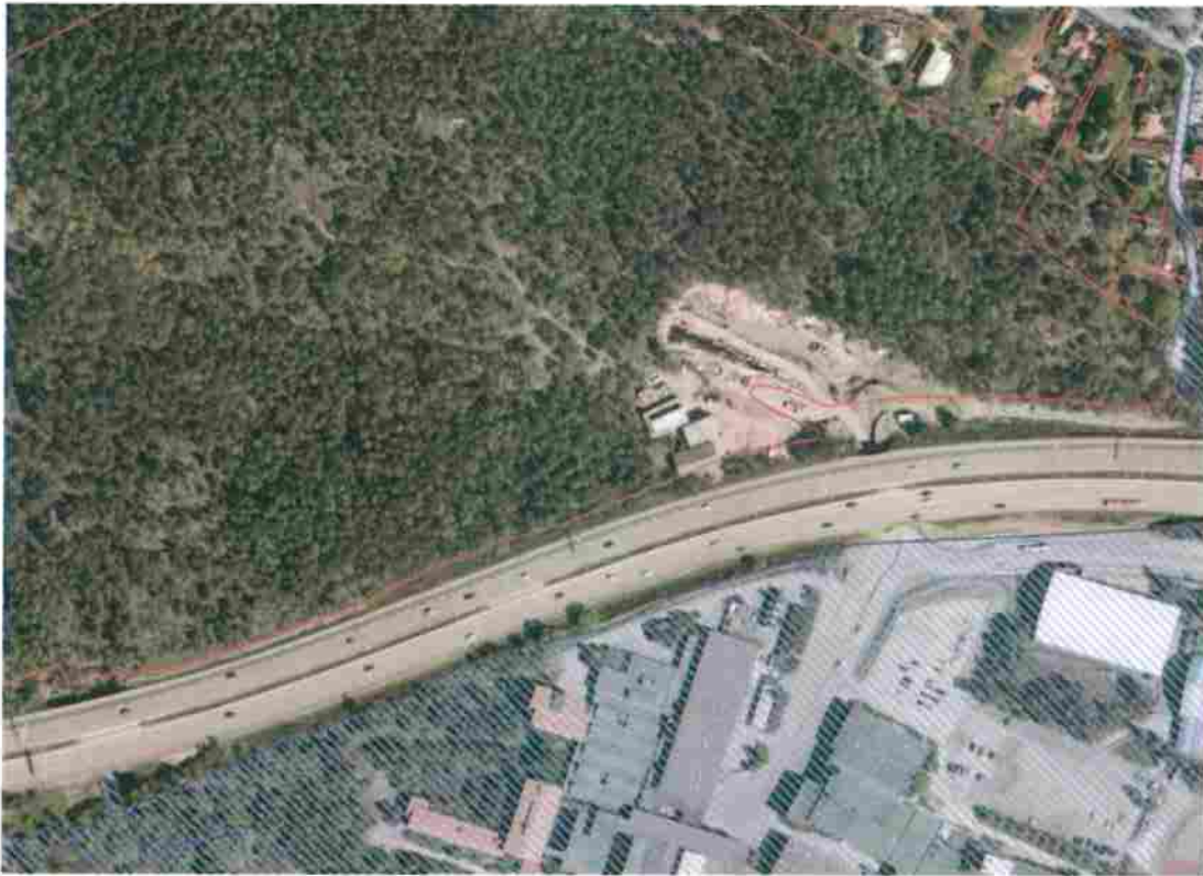
Kommunägd mark är markerad med skrafferad blå färg. Övrig mark är privatägd.

Ett detaljplaneprogram har tagits fram för centrala Nacka och antogs av Kommunstyrelsen i 13 april 2015. Syftet med detaljplaneprogrammet är att skapa en levande och attraktiv stads kärna i Nackas centrala delar. Arbetet utgår från visionen ”nära och nyskapande”. Planprogrammet är också en del i genomförandet av översiktsplanens strategi ”en tätare och mer blandad stad på västra Sicklaön”. Det tar ett helhetsgrepp för den framtida stadsutvecklingen och underlättar för kommande detaljplaner. Vid antagandebeslutet delegerades starten av de ingående stadsbyggnadsprojekten till planchefen och exploateringschefen.