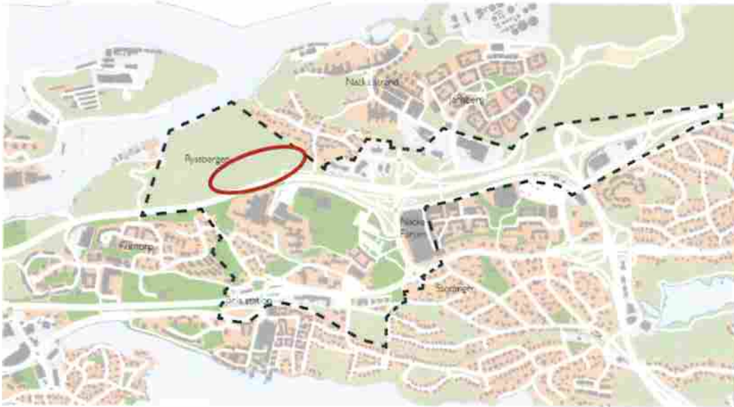
Detaljplaneområdets ungefärliga läge

Projektet ska ta fram en- eller två detaljplan/er och pröva möjligheterna för totalt cirka 40 000 m 2 BTA nya bostäder både öster och väster om tunnelmynningen till Kvarnholmsförbindelsen, en förskola i bostadsbebyggelsen och ca 8 000-12 000 m 2 verksamheter, i huvudsak längs med väg 222 Värmdöleden.