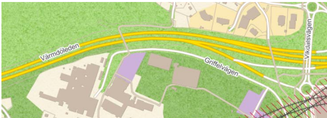
Bild 3: En eventuell depå i Nacka kommun skulle enligt lokaliseringstudien förläggas inom detta område.

En eventuell järnvägsplan för depå i Nacka kommun kommer i sådant fall att samordnas med en detaljplan för depå.