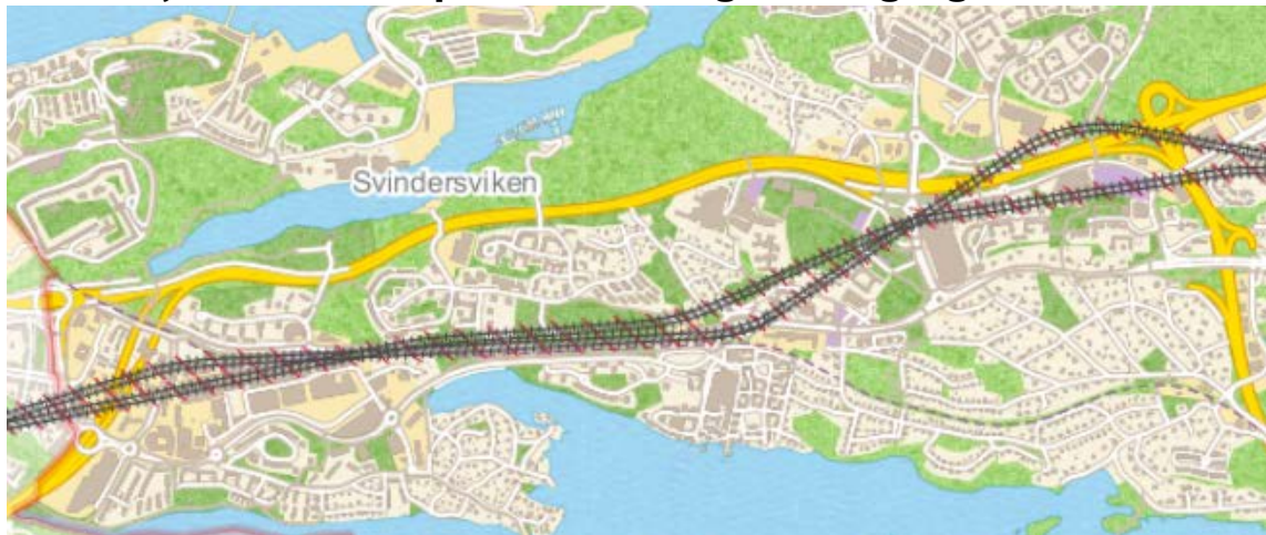
Bild 2: Kartbilden visar Projektets geografiska läge. Projektområdet begränsas till samma område som järnvägsplanen. I syfte att skapa bättre stationslägen har Nacka kommun begärt ett justerat spårläge (i förhållande till det spårläge som tidigare redovisats) varför två varandra närliggande spårdragningar visas på kartan. Exakt spårdragning bestäms i järnvägsplanen.

I detta projekt blir stationen i Nacka C slutstation för tunnelbanan, men spåren kommer att fortsätta efter stationen för att möjliggöra uppställning av tåg. Längden på dessa stickspår är ännu inte klarlagd. En idéstudie har genomförts för en framtida förlängning av tunnelbanan till Orminge 1 , och det säkerställs att projektet Tunnelbana till Nacka inte möjliggör en sådan förlängning.