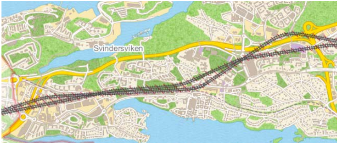
Bild 4: Detaljplanen kommer att ha samma avgränsning som järnvägsplanen. I syfte att skapa bättre stationslägen har Nacka kommun begärt ett justerat spåråläge (i förhållande till det spåråläge som tidigare redovisats) varför två varandra närliggande spårdragningar visas på kartan. Exakt spårdragning bestäms i järnvägsplanen.

Marken på sträckan ägs av både privata fastighetsägare, Staten och av Nacka kommun. Större delen av detaljplanen gäller för en tunnel minst 20 meter under marknivå. Detaljplanens bestämmelser ska bland annat ge förutsättningar för utbyggnad av tunnelbanan och medge tredimensionell fastighetsbildning. Detaljplanen bedöms enbart påverka markanvändningen vid stationsentréer. När detaljplanen är genomförd bedöms den därför ha liten påverkan på ytlägen. Projektet bedöms därför inte ha negativ påverkan på tidplaner och förutsättningar för övrigt detaljplanarbete på västra Sicklaön. När mark inom tunnelbanesträckningen i framtiden planläggs för annan verksamhet än tunnelbana kommer dessa detaljplaner även medge tunnelbana genom planbestämmelser.